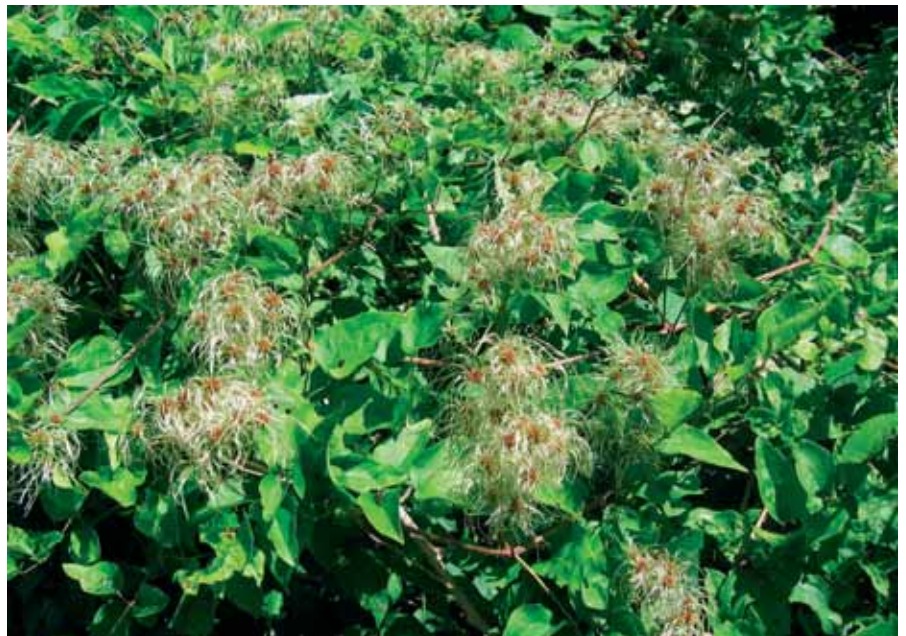
Parcelle en FD Haye (54) : la clématite forme d'épais tapis couvrant le recrû ligneux

Dans les peuplements du Nord-Est de la France, la clématite est particulièrement menaçante dans les zones bouleversées par les guerres (zone rouge) et reboisées en résineux dans les années qui suivirent : ces peuplements sont aujourd'hui en cours de renouvellement, bien souvent par plantation de hêtre sous abri. Les travaux de nivellement du sol, la situation de mi-lumière, la présence des bandes d'abri qui offrent un support idéal à la clé-