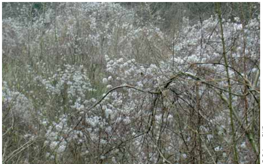
Parcelle en régénération envahie par la clématite

plantation) ne permet de contenir la clématite que pendant deux à trois ans