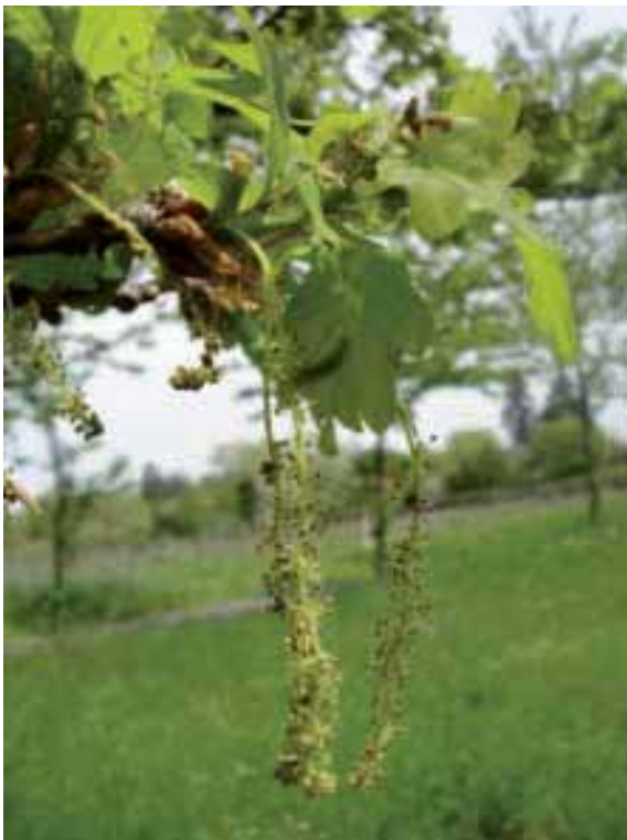
G. Philippe, Cemagref

La floraison des chênes blancs est incontestablement plus régulière que leur fructification puisque la grande majorité des arbres porte des fleurs chaque année. Toutefois, la nature des bourgeons et, de ce fait, le nombre de fleurs produites varient selon les années. Ainsi, Bonnet-Masimbert (1984) a montré qu'une bonne année de fructification se différencie d'une mauvaise année par une plus forte proportion de bourgeons mâles et hermaphrodites et par l'absence de bour-