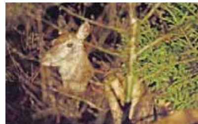
Biche dans la lumière d'un phare lors du suivi par indice nocturne

■ les dates des répétitions : les soirées retenues pour la réalisation du suivi doivent être choisies en dehors des jours de dérangements significatifs du milieu (battue par exemple). Quant au délai entre les répétitions, il est difficile de formuler une recommandation à ce propos, par manque de connaissances scientifiques. A priori , les répétitions organisées sur des soirs consécutifs sont à éviter à cause des phénomènes d'auto-corrélation. À l'opposé, quand le suivi est réalisé au moment de la « franche repousse de l'herbe », il semble préférable de répartir les répétitions sur un maximum de 3 semaines ; une amplitude supérieure peut influencer sur les résultats car la répartition spatiale des animaux est alors susceptible de changer du fait des évolutions rapides de la qualité de l'offre alimentaire.