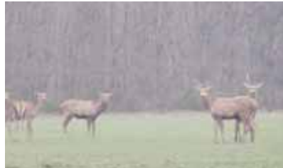
Animaux vus de jour à proximité d'un circuit : lors du suivi, ne pas s'écarter du parcours pour les retrouver

Les pratiques recensées sont résumées dans le tableau 1.