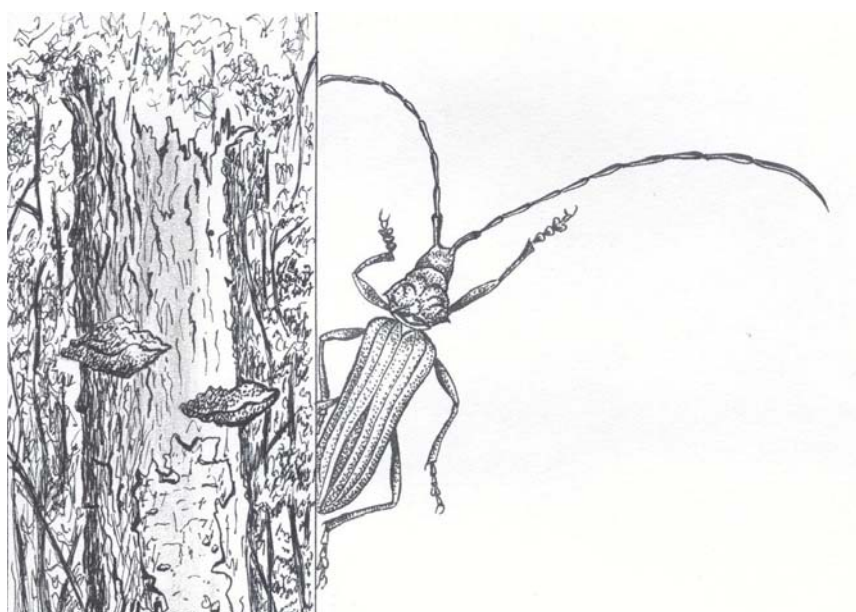
Figure 10 : Cerambycidae, chandelle et polypores (dessin G. Goujon).