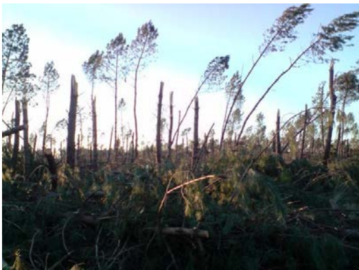
Figure 4 : dégâts dans le secteur de Solferino

Après cette rapide inspection, une des premières préoccupations exprimées par les enquêtés est de dégager au plus vite les pistes afin de minimiser les risques d'incendies au début du printemps. En accédant à leurs parcelles, ils procèdent aussi à l'estimation des dégâts dans les jours et les semaines qui suivent.