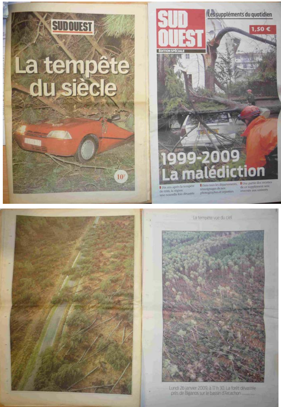
Figure 3 : page de garde et 4 ème de couverture des suppléments « tempête » du journal Sud Ouest de 1999 et 2009.

Pour l'ensemble des sylviculteurs que nous avons interrogés, l'arrivée brutale de cette deuxième tempête est un choc. Ils ne s'attendaient pas à revivre si rapidement un évènement de même ampleur que la tempête de 1999. Moralement très affectés, leurs réactions sont diverses.