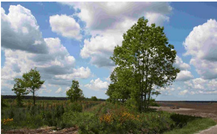
Figure 7 : Lisière de feuillus maintenue entre un champ et une jeune plantation de pins maritimes – Gironde

Malgré cette norme sociale qui dévalorisait la présence de feuillus, la plupart des forestiers interrogés déclarent avoir maintenu des boisements, parfois depuis longtemps, mais souvent dans des conditions très particulières. Aujourd'hui, ces boisements feuillus sont souvent très hétérogènes dans leur composition et leur structure. Ils occupent des zones à l'écart ou en périphérie des peuplements de pins maritimes, le long des ruisseaux, dans les fonds de vallons, sur des terrains très ingrats, peu mécanisables et de très petites taille.