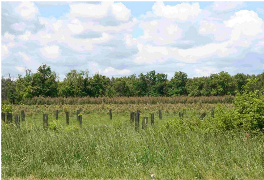
Figure 8 : jeune lisière feuillue à proximité d'un boisement de pin maritime avec en arrière plan une lisière feuillue ancienne dans le Sud Gironde (photo Ph. Deuffic, mai 2007)

Pourtant, ce programme, relativement bien doté et intéressant financièrement pour les propriétaires et les gestionnaires forestiers a connu un succès mitigé