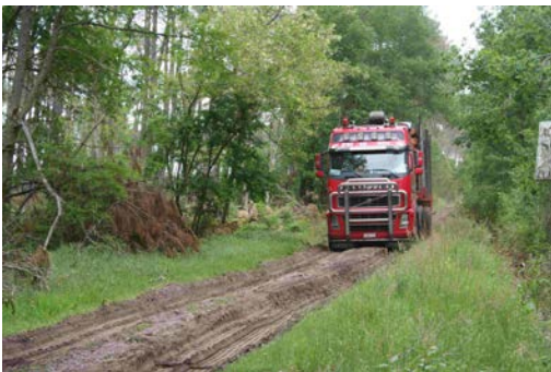
Figure 5 : transporteur belge venu à l'occasion de la tempête dans le canton de Morcens

Très vite, les propositions d'achats de bois faites aux sylviculteurs s'avèrent bien en deçà de ce qui avait été annoncé en début de crise par les représentants de la profession. Beaucoup de sylviculteurs rencontrés en avril avaient déjà vendu une partie de leur bois dès les premières semaines qui avaient suivi la tempête malgré les mots d'ordre syndicaux qui préconisaient de ne pas vendre de bois à n'importe quel prix.