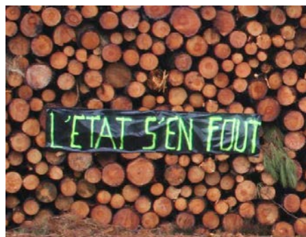
Figure 6 : banderole de protestation envers l'action de l'Etat en bordure de l'autoroute A63

Lors des entretiens réalisés en mai et septembre 2009, beaucoup de forestiers se déclaraient exaspérés par la complexité du montage des dossiers de subvention, la lenteur des traitements administratifs, les incertitudes sur les montants et les dates de versements . Certains forestiers du G2 expliquent la lenteur du déblocage des aides financières par le manque de reconnaissance auquel sont confrontés les sylviculteurs notamment vis-à-vis du régime d'indemnisation des catastrophes naturelles en vigueur dans le secteur agricole :