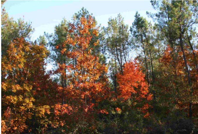
Figure 10 Lisière de chêne rouge à l'automne