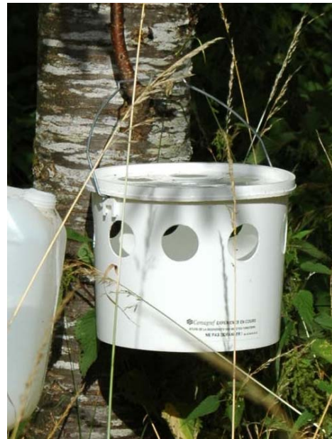
Photo 3 : Seau blanc contenant un liquide mouillant et un appât de benzyl acétate pour la capture des Coléoptères saproxyliques.

Les guêpes et autres grands Hyménoptères peuvent causer des dégâts aux insectes capturés. Les grandes quantités de Noctuelles et de Vespides capturées en fin de saison (août) peuvent aussi dégrader les échantillons par putréfaction et salissement par les écailles, mais aussi saturer le piège. Plus efficace dans les régions les plus chaudes.