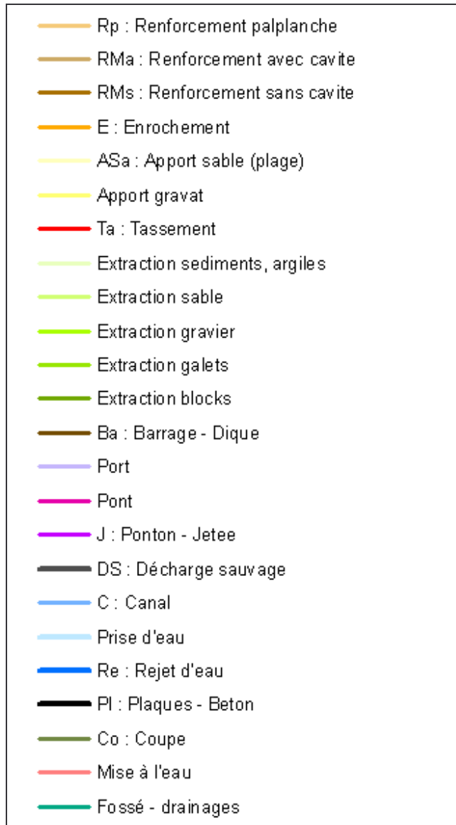
Figure 1 : Proposition de palette de couleur par type de modification