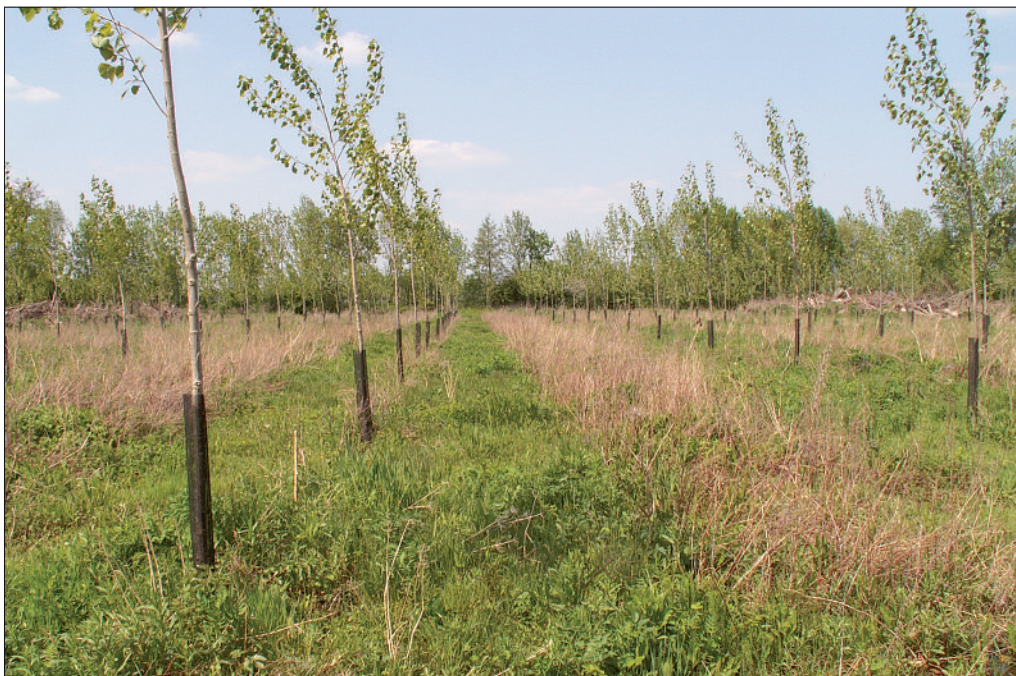
Photo 1 Peupleraie jeune classique