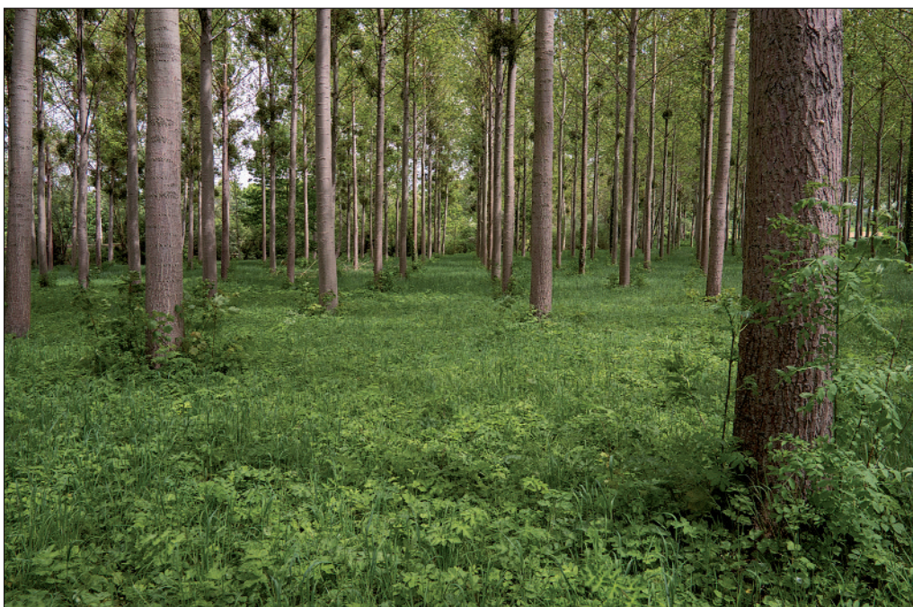
Photo 2 Peupleraie âgée classique