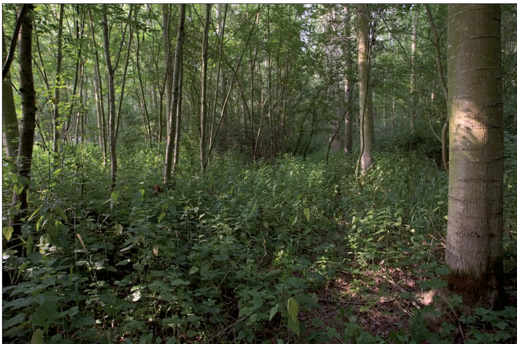
Photo 4 Peupleraie âgée à sous-étage