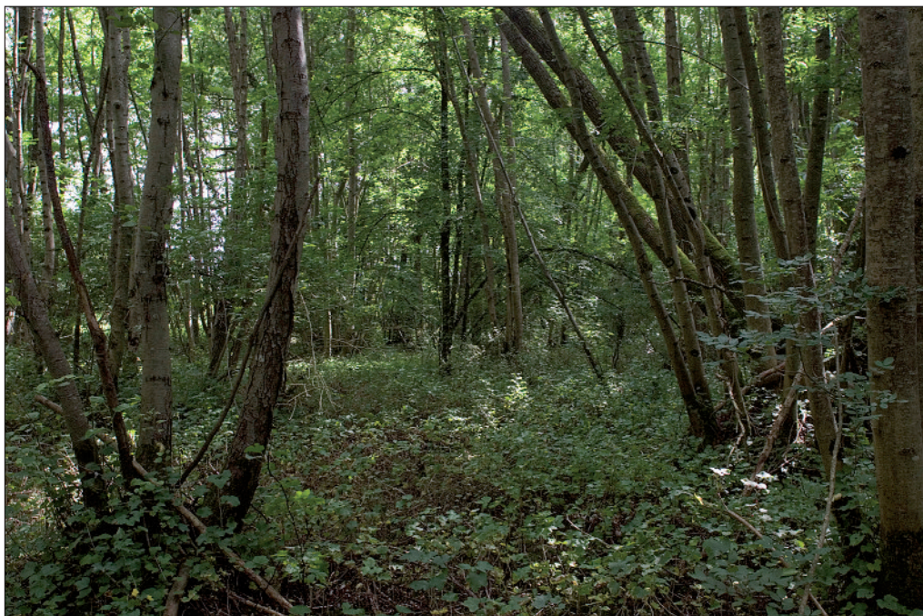
Photo 3 Forêt subnaturelle