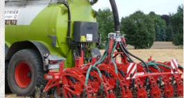
Photographie : Strip-till – Seulement une partie de la surface est cultivée

Les barrières à l'adoption ne dépendent pas seulement de la BMP elle-même. Elles peuvent résulter de façon importante du contexte régional (législation, texture du sol, etc.).