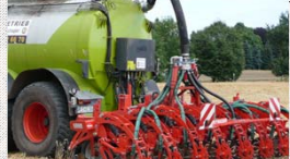
Photographie : Strip-till – Seulement une partie de la surface est cultivée

Les barrières à l'adoption ne dépendent pas seulement de la BMP elle-même. Elles peuvent résulter de façon importante du contexte régional (législation, texture du sol, etc.).