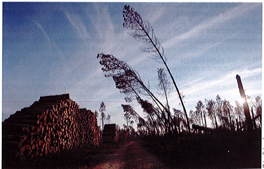
Deux ans plus tard, le journal Les Echos (25/01/2011) titre sur « L'avenir incertain de la forêt landaise » avec cette image