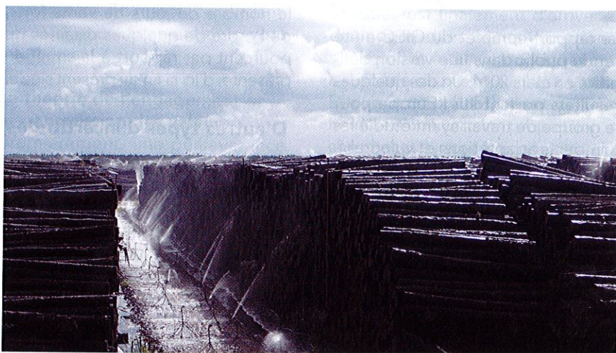
B. Gambelin, ONF