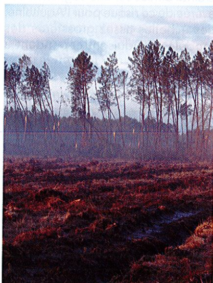
B. Gambelin, ONF

Continuer la sylviculture malgré le risque, c'est aussi penser logistique : déblayer, exploiter, commercialiser