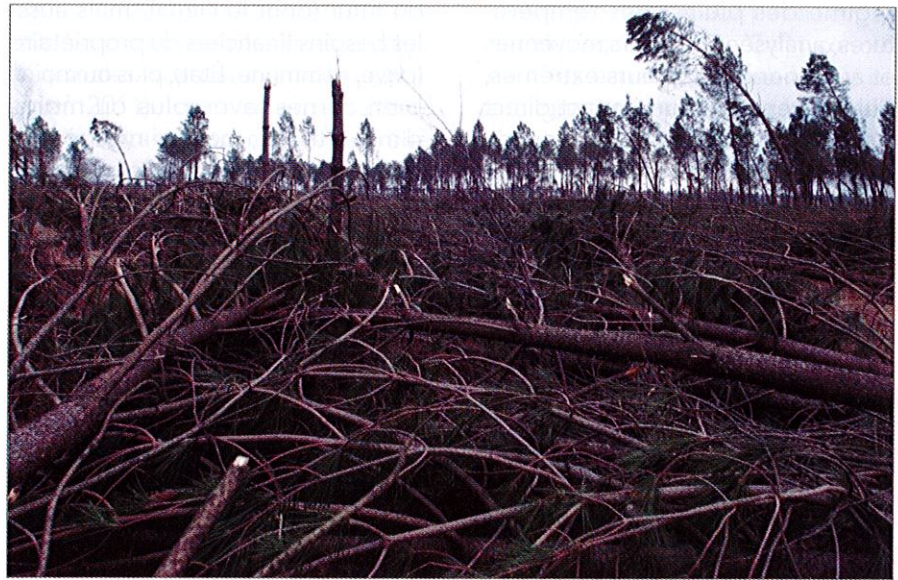
En quelques heures, une grande partie des forêts landaises est à terre