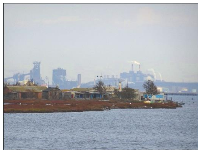
FIGURE 3: PORT-SAINT-LOUIS DU RHONE

Les deux villes sont comparables dans leur structuration socio-économique (revenus et seuil de pauvreté), mais contrastées dans leur type d'exposition à la submersion (totale vs partielle), et leur activité économique principale (industrielle pour Port-Saint-Louis, touristique pour Fréjus). Bien qu'elles n'aient pas le même nombre d'habitants, le même nombre de personnes est concerné en cas d'inondation par submersion marine : environ 9 000 personnes (la totalité des habitants de Port-Saint-Louis et 20% des habitants de Fréjus).