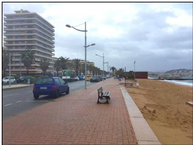
FIGURE 4: FREJUS