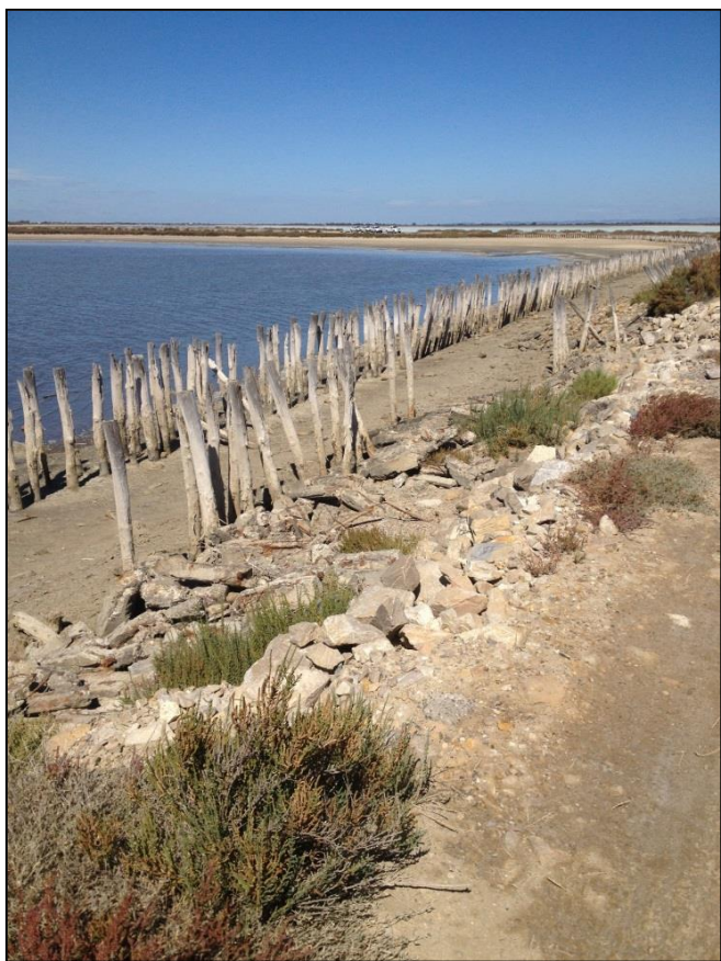
FIGURE 1: APERÇU DU SITE D'IMPLANTATION DE LA PLATEFORME DIGUE 2020 – PARC NATUREL DE CAMARGUE

Le choix du site pour l'implantation de la plateforme a été identifié après étude des différents critères listés plus haut et validé auprès des acteurs locaux du Parc Naturel Régional de Camargue fin Mars 2018. L'ouvrage sera implanté sur la digue à la mer existante illustrée ci-contre, à proximité des étangs du Fangassier et du Galabert. Il est conçu pour être parfaitement intégré et très peu visible dans un environnement naturel exceptionnel et très protégé.