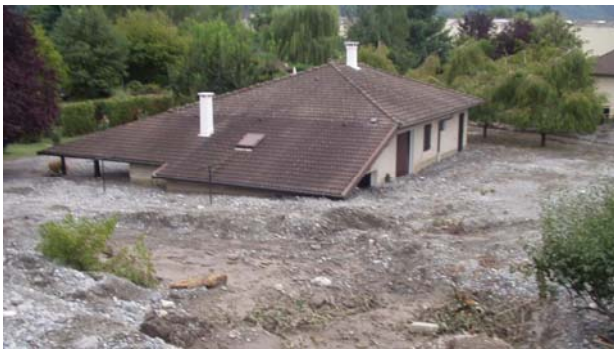
FIGURE 8 : MAISON ENGRAVÉE SUITE À UNE BRÈCHE DANS LA DIGUE - DOMENON - DOMÈNE (38) - 2005

Les conclusions ci-dessus ne sont pas transposables dans le cas de lits fortement et "artificiellement" perchés ou en présence de digues de grande hauteur, où il peut s'avérer nécessaire de tenir compte d'un sur-aléa sur une bande plus large à proximité de l'ouvrage.