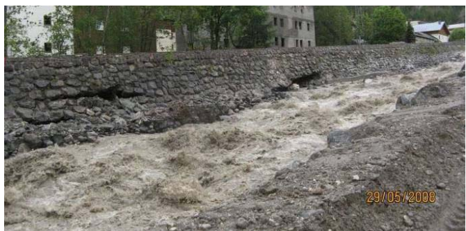
FIGURE 4 : AFFOUILLEMENT DU PIED DE DIGUE - LA VALLOIRETTE - VALLOIRE (73) - MAI 2008

Comme indiqué précédemment, l'incision généralisée du lit peut être une conséquence morphologique d'un endiguement trop étroit.