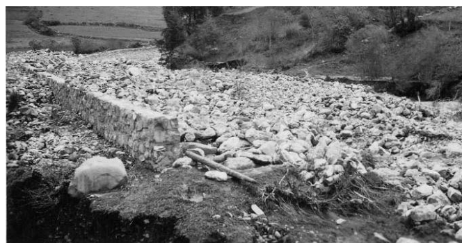
FIGURE 5 : SURVERSE SANS RUPTURE SUITE A L'ENGRAVEMENT DU LIT - CHAGNON - VARS (05) - 1957

Dès qu'une fraction significative du débit liquide déborde en dehors du lit endigué, la capacité de transport solide est fortement réduite, ce qui amplifie le dépôt de matériaux et augmente d'autant le débit débordant. Le phénomène peut s'emballer rapidement conduisant à un engravement total du chenal et à un changement de lit. Tout le débit peut alors déborder en dehors du chenal endigué.