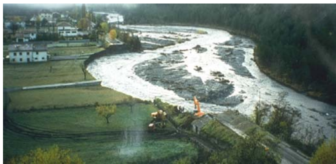
FIGURE 3 : LARGE BRECHE DUE A UNE EROSION EXTERNE SANS DEBORDEMENT - VAR - GUILLAUMES (06) - 1994 (ONF)

Les érosions sont paradoxalement moins marquées avec des laves torrentielles boueuses. Ce sont plutôt les écoulements plus liquides qui suivent les bouffées de laves et génèrent du charriage, qui sont généralement à l'origine des érosions.