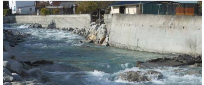
FIGURE 7 - RUPTURE ET REPARATION D'URGENCE D'UNE DIGUE - GAVE DE CAUTERETS - PIERREFITTE (65) - 2013

L'effondrement du mur-digue en béton en rive gauche du Gave de Cauterets (figure 7) est survenu hors crue, suite au fort sous-cavage de ses fondations lors de la crue de 2013.