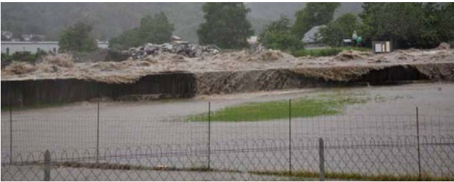
FIGURE 6 : SURVERSE SUR LA DIGUE - GAVE DE CAUTERETS - PIERREFITTE (65) - JUIN 2013

Les débordements limités de laves torrentielles par-dessus les digues sont en général peu pénalisants pour le remblai. Les écoulements plus liquides qui suivent les bouffées de laves, et qui peuvent divaguer suite à l'obstruction du chenal sont plus érosifs. Cependant, leur débit reste relativement faible.