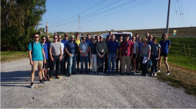
FIGURE 3 : UN GROUPE D'EXPERTS DE TROIS PAYS PARTICIPANT A UN EXERCICE DE COMPARAISON DE METHODES D'EVALUATION DU RISQUE A SAINT LOUIS (USA)

On peut prendre comme exemple de partage d'expérience enrichissant (parmi de nombreux autres) le cas des digues japonaises rompues par liquéfaction suite à un séisme (figure 4), événement beaucoup plus rare en Europe bien que toujours possible [13].