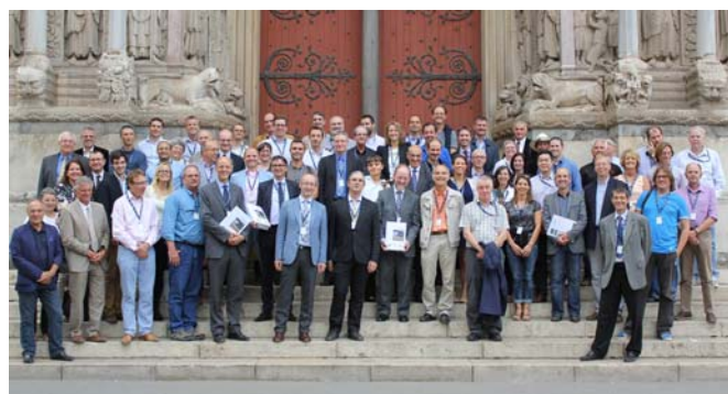
FIGURE 1 : PHOTO DE GROUPE EN ARLES D'UNE PARTIE DES CONTRIBUTEURS A L'ILH, LORS DE LA CEREMONIE D'INAUGURATION EN 2013

La conférence internationale FLOODrisk, qui s'est tenue en 2008 à Oxford en clôture du projet FLOODsite, a eu comme ambition de rassembler non seulement les scientifiques mais aussi tous les autres types d'acteurs de la gestion du risque inondation. Suite à une décision prise lors d'une réunion en marge de cette conférence, le projet de rédaction d'un guide international sur les digues de protection, l'International Levee Handbook 2 , a été lancé. La parution et le lancement de l'ouvrage [1], en octobre 2013 (figure 1), ont eu lieu simultanément à l'atelier final du projet de recherche européen FloodProBE 3 (2009-2013) [3]. Une des conclusions de cet atelier était qu'il était souhaitable qu'une communauté de pratique internationale autour de la gestion du risque inondation se mette en place de manière pérenne. Cet intérêt était démontré par le résultat très positif de ces différentes initiatives et de la seconde conférence FLOODrisk qui s'est tenue en 2012 à Rotterdam, la dynamique alors présente et le constat généralement partagé de la plus-value des échanges internationaux.