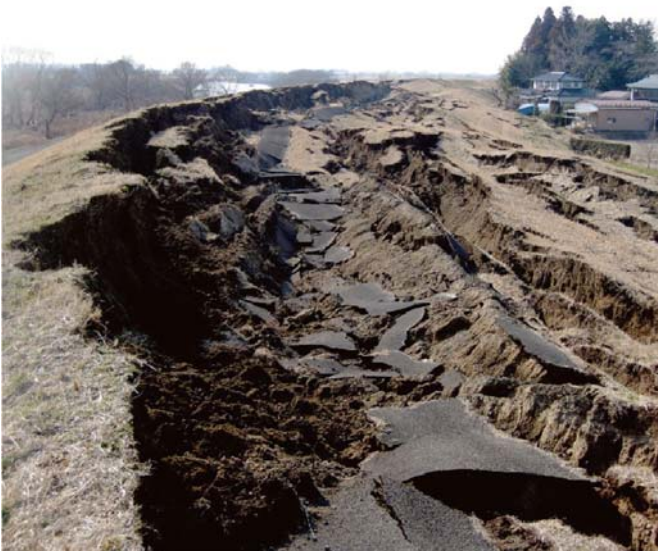
FIGURE 4 : RUPTURE DE DIGUE DE LA RIVIERE NARUSE PAR LIQUEFACTION SUITE A UN SEISME (2011) AU JAPON

On peut prendre comme exemple de partage d'expérience enrichissant (parmi de nombreux autres) le cas des digues japonaises rompues par liquéfaction suite à un séisme (figure 4), événement beaucoup plus rare en Europe bien que toujours possible [13].