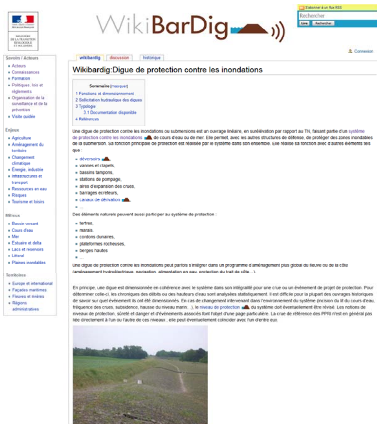
FIGURE 3: EXEMPLE DE PAGE DE L’OUTIL WIKIBARDIG (20/06/2018)