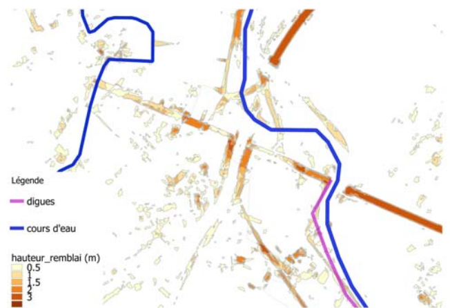
FIGURE 3 : REMBLAIS EN PREMIER ET SECOND RANG

Le recensement des ouvrages apporté par la bibliographie a été complété d'une analyse des données topographiques [9]. Ainsi, des remblais non identifiés auparavant comme digues de protection apparaissent dans la continuité de la protection principale, ou en second rang en délimitant des casiers dans la zone protégée.