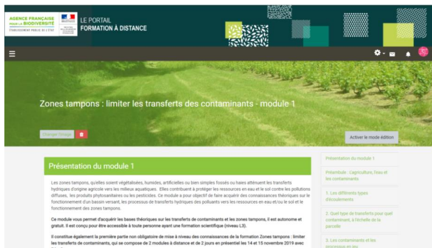
Figure 2: page d'accueil du module 1

Le module 2 (obligatoire) en e-learning également, s'étale sur 7h. L'inscription à cette formation est soumise à la réussite à un test : en cas d'échec, le suivi du module 1 sera rendu obligatoire. Le module est basé sur des retours d'expérience ; il permet d'approfondir les concepts vus dans le module 1, d'acquérir des ordres de grandeur selon les contextes, et de remobiliser les connaissances acquises sur des exercices « cas pratiques » dans des situations contrastées. Les exercices se feront en groupes, afin de favoriser les échanges, le partage entre les apprenants ainsi que le réseautage à moyen terme. La méthodologie à mettre en œuvre pour réaliser un diagnostic d'implantation de zones tampons est présentée (Figure 3)), en s'appuyant en « fil rouge » sur un exemple constitué par le bassin versant sur lequel s'appuie la formation en présentiel. Il s'agit d'acquérir les compétences nécessaires à la réalisation d'un pré-diagnostic sur un bassin versant ou une AAC, afin de tirer au mieux profit de la formation en présentiel qui suit.