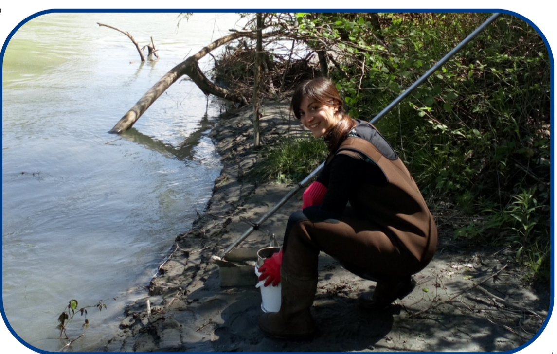
Prélèvement de sédiment

3. 30 jours après la pose, récupération des capteurs passifs, des pièges à biofilm, prélèvement de sédiment