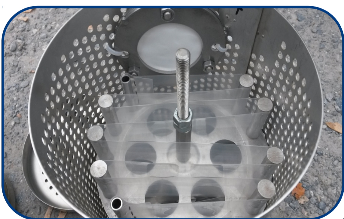
POCIS et piège à biofilm

1. Pose des capteurs passifs (POCIS) et des pièges à biofilms