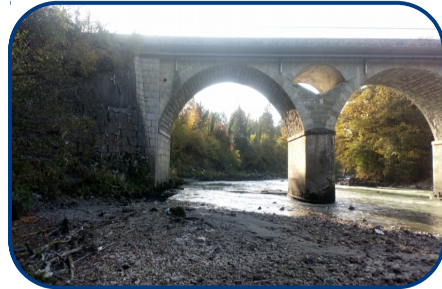
Site aval sur l'Arve (L2)