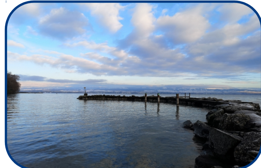
Site de Rovorée, Léman (L1)