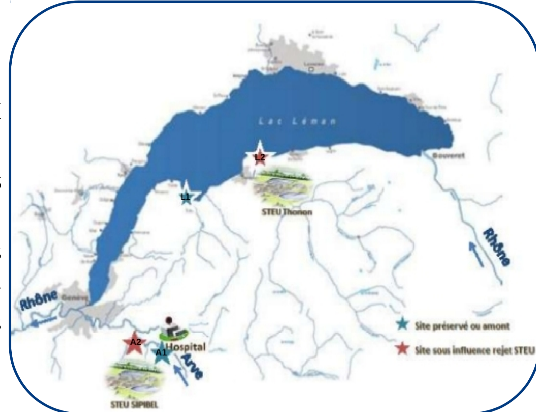
Situation des sites étudiés sur le Léman et l'Arve

Les résidus pharmaceutiques se dispersent dans l'environnement aquatique du fait de rejets diffus (agricoles suite aux traitements vétérinaires ou épandages des déchets, assainissements individuels...), et de leur transport massif via les eaux usées collectées dans les stations de traitement des eaux usées (STEU). Les antibiotiques vont ainsi contaminer les eaux de surface , à des concentrations allant du ng/L au µg/L , mais également les sédiments et le biote. La présence d'antibiotiques dans les écosystèmes exerce une pression de sélection sur les communautés microbiennes favorisant la dissémination et la persistance d'antibiorésistance . Cependant les connaissances sur la répartition des antibiotiques comme des antibiorésistances et leur dynamique temporelle dans les milieux aquatiques sont limitées.