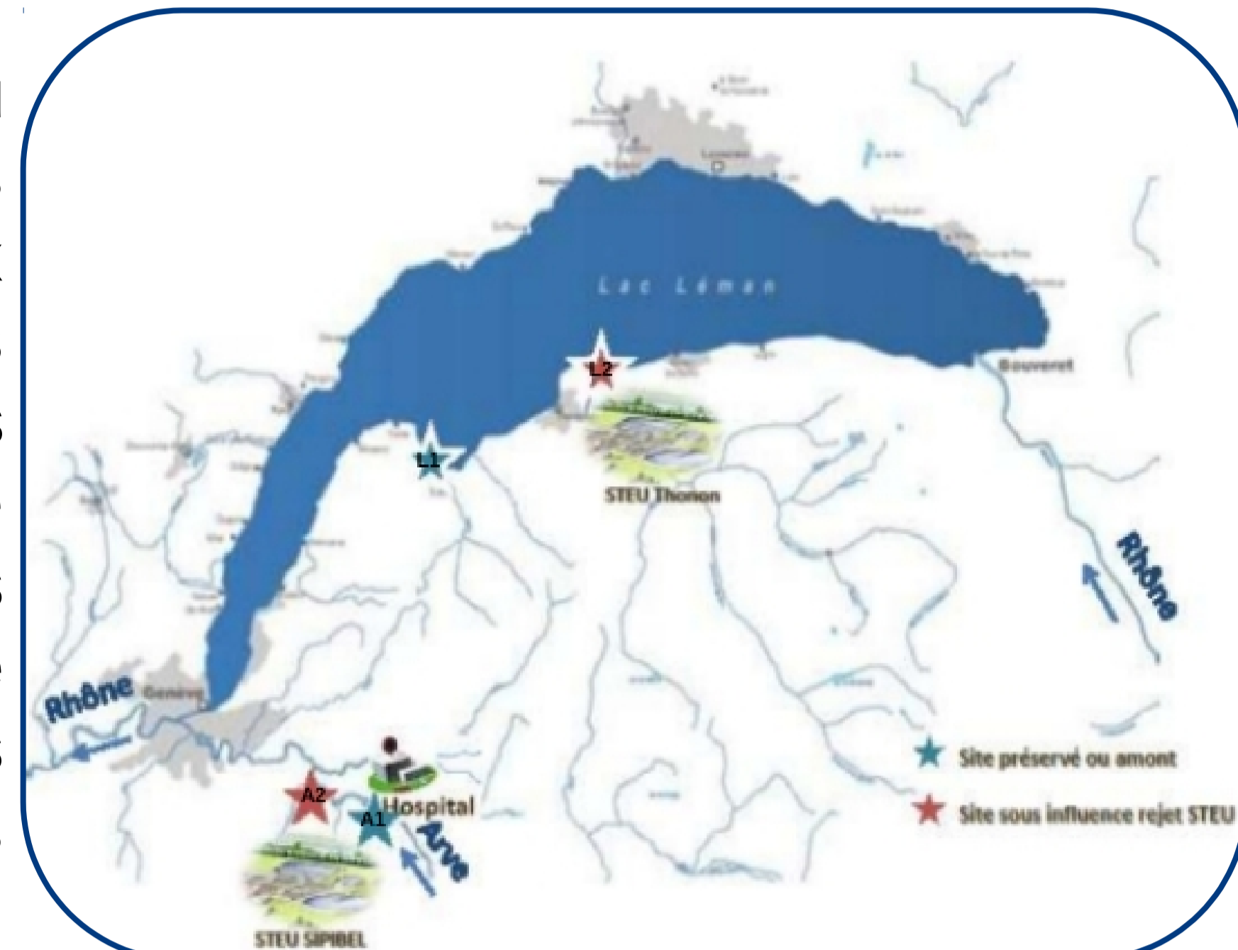
Situation des sites étudiés sur le Léman et l'Arve

Les résidus pharmaceutiques se dispersent dans l'environnement aquatique du fait de rejets diffus (agricoles suite aux traitements vétérinaires ou épandages des déchets, assainissements individuels...), et de leur transport massif via les eaux usées collectées dans les stations de traitement des eaux usées (STEU). Les antibiotiques vont ainsi contaminer les eaux de surface , à des concentrations allant du ng/L au µg/L , mais également les sédiments et le biote. La présence d'antibiotiques dans les écosystèmes exerce une pression de sélection sur les communautés microbiennes favorisant la dissémination et la persistance d'antibiorésistance . Cependant les connaissances sur la répartition des antibiotiques comme des antibiorésistances et leur dynamique temporelle dans les milieux aquatiques sont limitées.