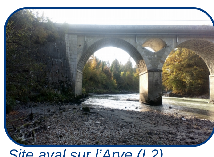
Site aval sur l'Arve (L2)