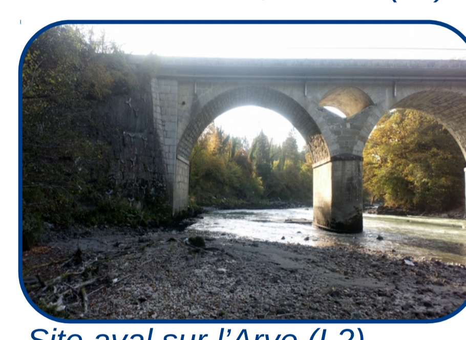
Site aval sur l'Arve (L2)