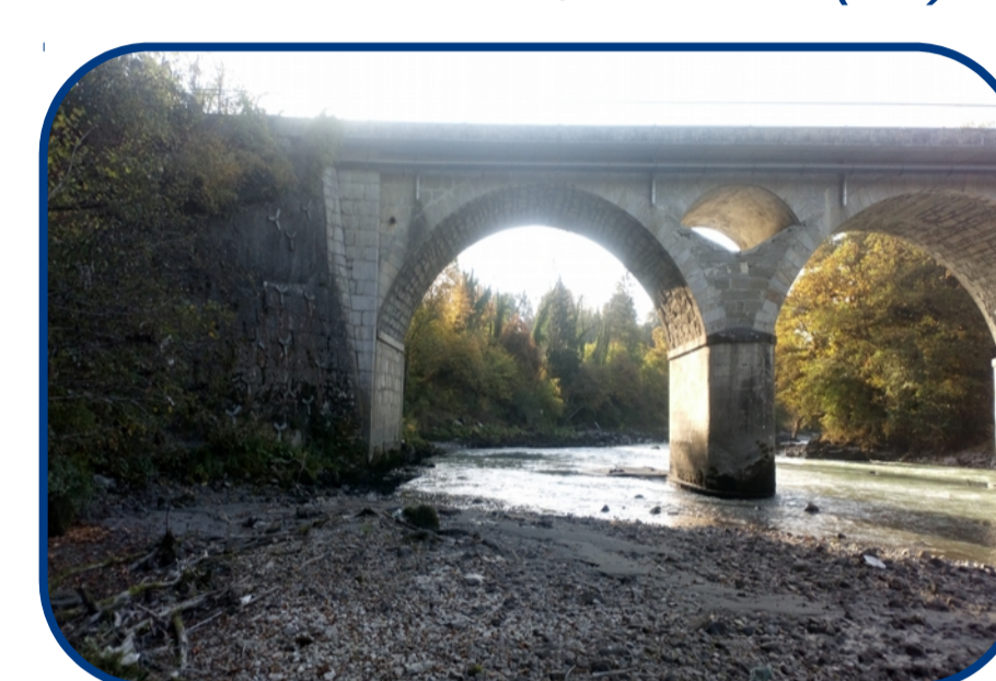
Site aval sur l'Arve (L2)