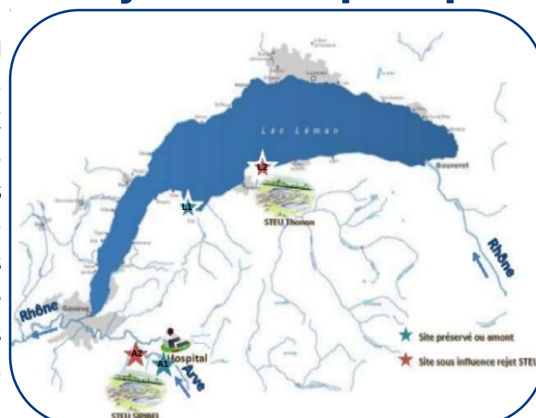
Situation des sites étudiés sur le Léman et l'Arve

Les résidus pharmaceutiques se dispersent dans l'environnement aquatique du fait de rejets diffus (agricoles suite aux traitements vétérinaires ou épandages des déchets, assainissements individuels...), et de leur transport massif via les eaux usées collectées dans les stations de traitement des eaux usées (STEU). Les antibiotiques vont ainsi contaminer les eaux de surface , à des concentrations allant du ng/L au µg/L , mais également les sédiments et le biote. La présence d'antibiotiques dans les écosystèmes exerce une pression de sélection sur les communautés microbiennes favorisant la dissémination et la persistance d'antibiorésistance . Cependant les connaissances sur la répartition des antibiotiques comme des antibiorésistances et leur dynamique temporelle dans les milieux aquatiques sont limitées.