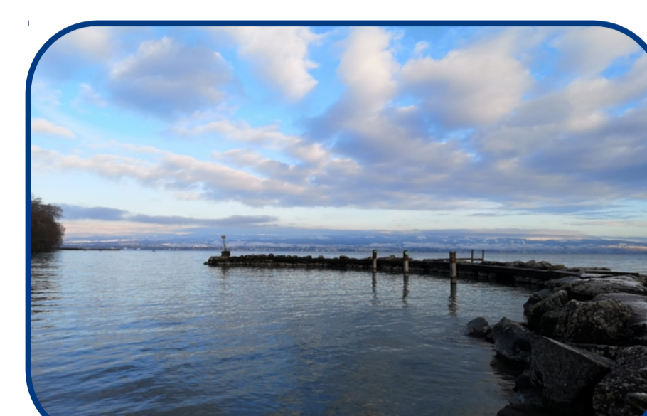
Site de Rovorée, Léman (L1)