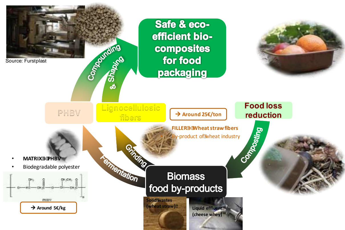
Figure 2 : Ambition du projet EcoBIOCAP : des résidus agro-alimentaires vers la production d'emballages alimentaires éco-efficent.

La combinaison des deux constituants, PHBV et charges de renfort ligno-cellulosiques permet d'ajuster les propriétés fonctionnelles (propriétés mécaniques, propriétés de transfert de matière aux gaz et à la vapeur d'eau) ainsi que le coût du matériau composite final (Berthet et al., 2015b).