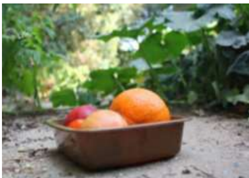
Figure 1 : Barquette biodégradable issue de sous-produits des industries agro-alimentaires : mélange Poly (3-hydroxybutyrate-co-3-hydroxyvalérate) (PHBV) et de fibres ligno-cellulosiques issues du broyage de pailles de blé. Projet européen EcoBioCAP ( www.ecobiocap.eu ).

Le projet EcoBioCAP a pour ambition de développer des emballages biodégradables, éco-efficaces en établissant un cycle dans le devenir de la matière (Figure 1). Il s'agit de valoriser des sous-produits des industries alimentaires. Des résidus liquides comme les eaux de lavage d'huileries d'olive et du lactosérum de fromageries ont été utilisés avec succès par les partenaires portugais (IBET) et italiens (Universités de Rome et de Bologne) comme substrat de fermentation pour la production d'un polymère bactérien, le Poly(3-hydroxybutyrate-co-3-hydroxyvalérate) (PHBV), copolymère de butyrate et valérate.