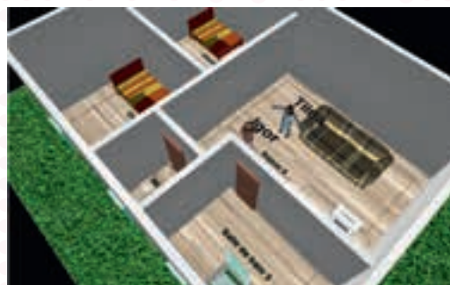
◀ Capture d'écran d'une simulation concernant la qualité de l'air intérieur réalisée avec GAMA.