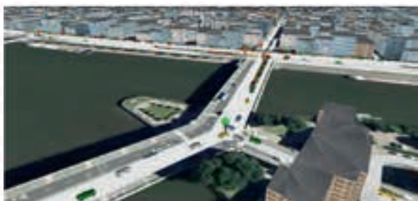
▲ Capture d'écran d'une simulation du trafic routier de la ville de Rouen réalisée avec GAMA.

Plus d'informations : http://gama-platform.org