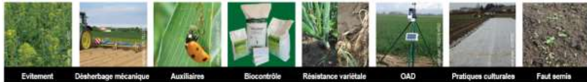
Figure 3 : Illustration des leviers agronomiques et techniques déployés dans la conduite IFT50.

Pour pallier la diminution des traitements dans l'itinéraire IFT50, plusieurs leviers agronomiques et techniques sont utilisés (Figure 3), comme l'utilisation de produits de biocontrôle (blé, pois de conserve, colza et chou-fleur), du désherbage mécanique (pomme de terre, colza, betterave, pois de conserve, oignon et chou-fleur) ou manuel (oignon et chou-fleur), de variétés résistantes ou tolérantes (toutes les cultures sauf le pois de conserve), de seuils d'intervention, du BSV, d'outils d'aide à la décision (OAD) comme Mileos® (pomme de terre), Miloni® (oignon), Kit pétale (Colza), SeptoLIS® (blé) et IPM (betterave), de faux semis (blé, pomme de terre et chou-fleur à une seule plantation) et enfin du rôle des auxiliaires des cultures dans le contrôle des ravageurs.+ décalages de date de semis (cité plus loin pour le blé)