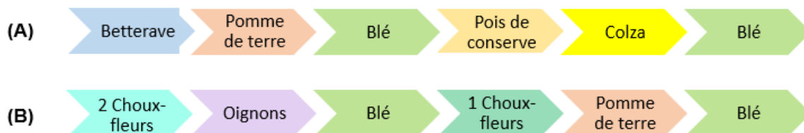
Figure 2 : Rotations des cultures mises en place dans les sites de Tilloy-lès-Mofflaines (A) et Lorgies (B).

L'assolement dans chaque site est construit avec les cultures pratiquées dans le bassin correspondant, en particulier la plaine de l'Artois pour le site de Tilloy-lès-Mofflaines et la plaine de la Lys Pévèle pour le site de Lorgies. Cet assolement, différent selon les sites, est le même pour les deux systèmes testés dans un site donné. Au total, 6 cultures sont mises en place dans chaque site expérimental, avec le blé qui est expérimenté en doublon dans chaque site (Figure 2). Pour le chou-fleur, deux types de culture sont retenues : une culture de chou-fleur avec une seule plantation (1 Chou) et une culture de chou-fleur avec deux plantations (2 Choux). Pour la culture 2 Choux, deux plantations sont mises en place : 2 Choux 1 ère plantation (2 Choux 1) et 2 Choux 2 ème plantation (2 Choux 2).