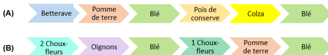
Figure 2 : Rotations des cultures mises en place dans les sites de Tilloy-lès-Mofflaines (A) et Lorgies (B).

L'assolement dans chaque site est construit avec les cultures pratiquées dans le bassin correspondant, en particulier la plaine de l'Artois pour le site de Tilloy-lès-Mofflaines et la plaine de la Lys Pévèle pour le site de Lorgies. Cet assolement, différent selon les sites, est le même pour les deux systèmes testés dans un site donné. Au total, 6 cultures sont mises en place dans chaque site expérimental, avec le blé qui est expérimenté en doublon dans chaque site (Figure 2). Pour le chou-fleur, deux types de culture sont retenues : une culture de chou-fleur avec une seule plantation (1 Chou) et une culture de chou-fleur avec deux plantations (2 Choux). Pour la culture 2 Choux, deux plantations sont mises en place : 2 Choux 1 ère plantation (2 Choux 1) et 2 Choux 2 ème plantation (2 Choux 2).