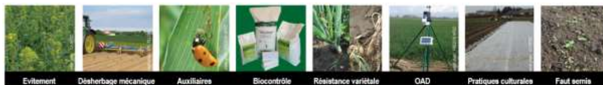
Figure 3 : Illustration des leviers agronomiques et techniques déployés dans la conduite IFT50.

Pour pallier la diminution des traitements dans l'itinéraire IFT50, plusieurs leviers agronomiques et techniques sont utilisés (Figure 3), comme l'utilisation de produits de biocontrôle (blé, pois de conserve, colza et chou-fleur), du désherbage mécanique (pomme de terre, colza, betterave, pois de conserve, oignon et chou-fleur) ou manuel (oignon et chou-fleur), de variétés résistantes ou tolérantes (toutes les cultures sauf le pois de conserve), de seuils d'intervention, du BSV, d'outils d'aide à la décision (OAD) comme Mileos® (pomme de terre), Miloni® (oignon), Kit pétale (Colza), SeptoLIS® (blé) et IPM (betterave), de faux semis (blé, pomme de terre et chou-fleur à une seule plantation) et enfin du rôle des auxiliaires des cultures dans le contrôle des ravageurs.+ décalages de date de semis (cité plus loin pour le blé)