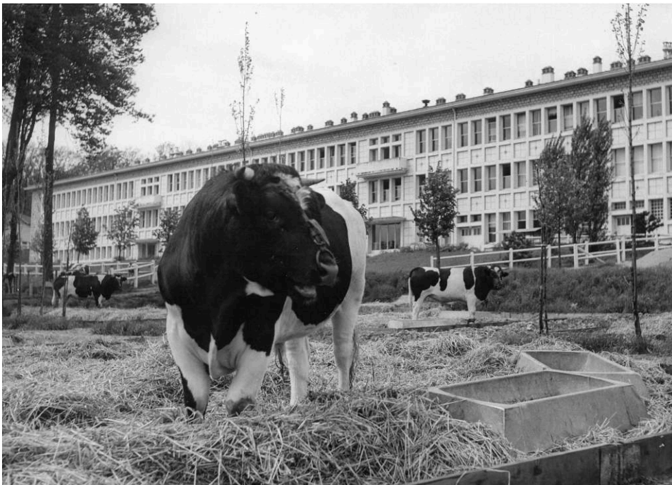
Taureau de race Française Frisonne Pie noir (FFPN) sur le domaine INRA du CNRZ à Jouy-en-Josas, 1958