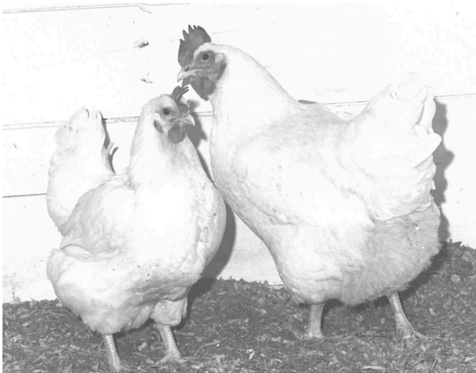
Une découverte de la recherche passée à l'industrie : la poule Vedette, reproductrice naine donnant des poulets à croissance normale lorsqu'elle est croisée avec un coq cornish, aux coté d'une poule de chair à croissance normale. INRA, station expérimentale d'aviculture du Magneraud, fin des années 1960.