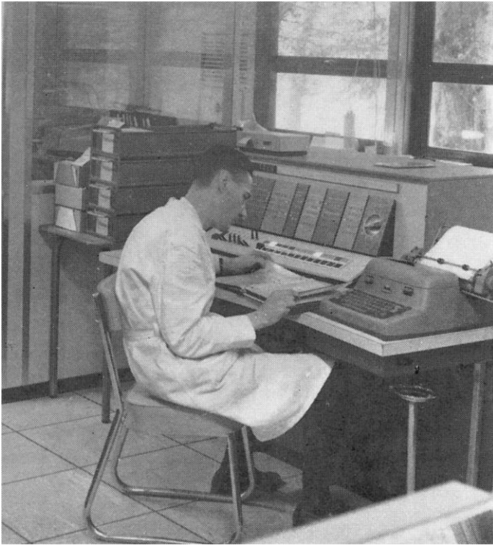
Atelier mécanographique. INRA, station de génétique animale CNRZ Jouy-en-Josas, 1966.