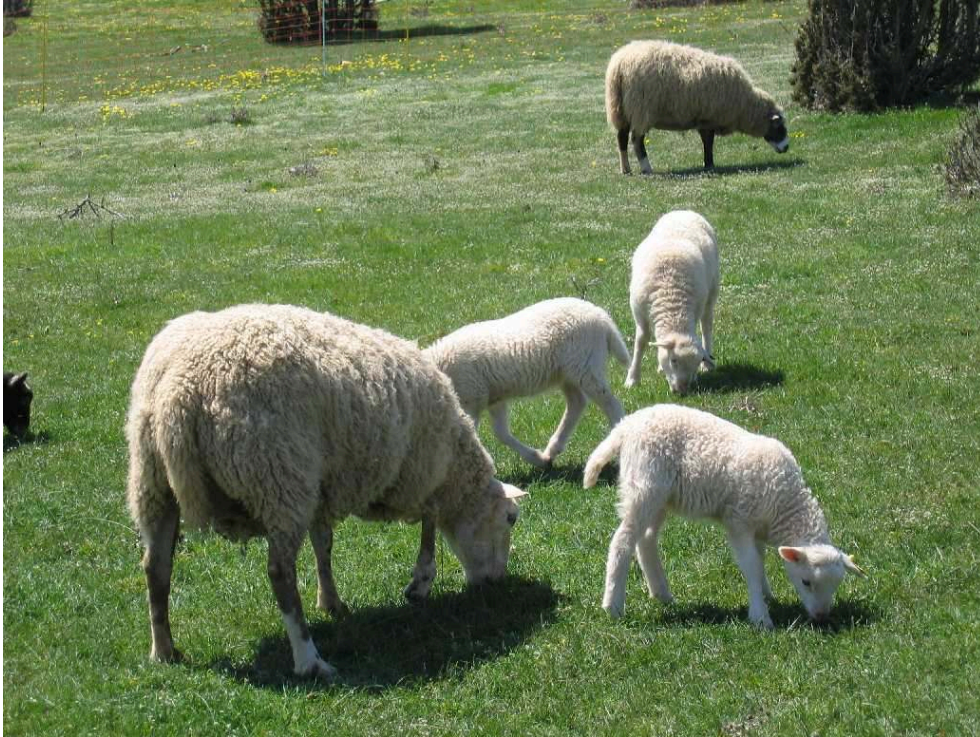
Brebis et agneaux INRA , une lignée synthétique constituée par croisement avancé entre Berrichon du Cher et Romanov, et devenue race Romane INRA

nucléotidique par nucléotide). Cette évolution entraîne ainsi une nécessaire évolution des compétences des chercheurs comme des praticiens de la sélection. On peut aussi s'interroger sur les conséquences de la sélection génomique sur le devenir du socle collectif des programmes d'amélioration génétique, la motivation des éleveurs-sélectionneurs de base face à une 'externalisation' grandissante de leur mission sociale ou le régime de propriété des données nécessaires à la sélection (Guillaume et al., 2011 ; Labatut et al., 2013).