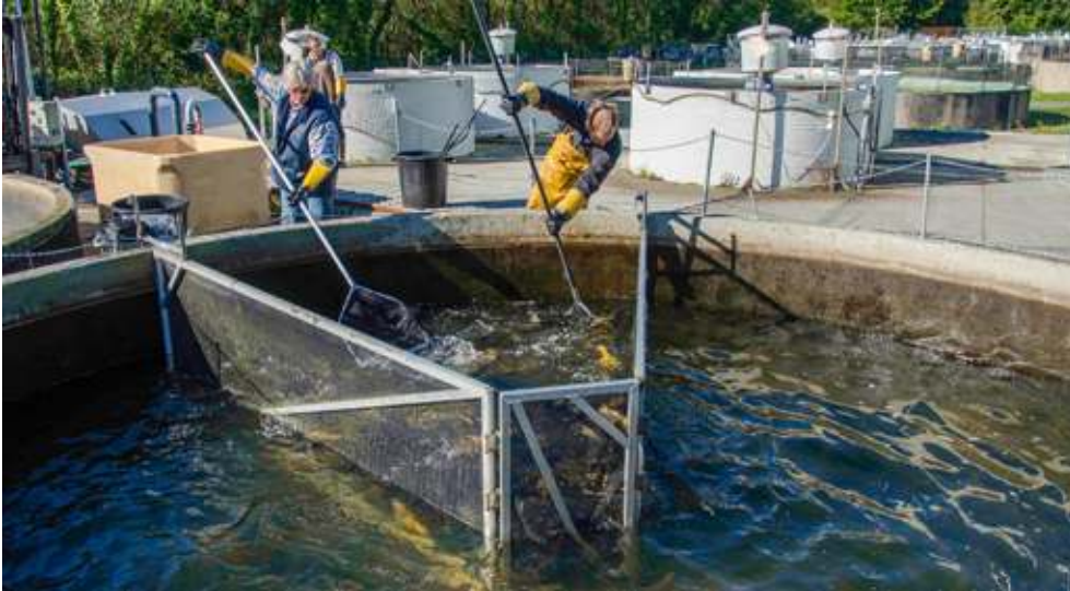
Bassin d'élevage de truites arc-en-ciel sur le site de la pisciculture expérimentale INRA des Monts d'Arrée, support de nombreux projets de recherche en génétique animale, en physiologie et santé animales, et en systèmes d'élevage.