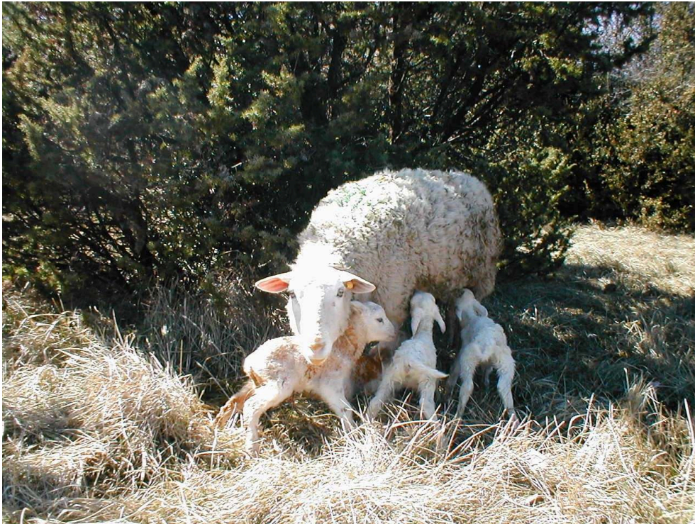
Brebis et agneaux INRA , une lignée synthétique constituée par croisement avancé entre Berrichon du Cher et Romanov, et devenue race Romane