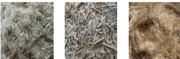
Figure 2. Différentes vues de fractions végétales obtenues après les étapes d'extraction de fibres

Tous les essais sont menés sur les lots non rouis (NR) et rouis (R). Pour ces lots, deux expériences sont réalisées, une sans ré-humidification (RS et NRS) et une autre avec ré-humidification avec de l'eau liquide (RH et NRH). Chaque prélèvement a été effectué pendant 10 min. Ensuite, les trois fractions obtenues (mat, anas et poussières collectées dans les trois modules et mélangées en une seule fraction de poussières) sont pesées. Le bilan de matière peut ensuite être déterminé pour chaque échantillon. Le mat est principalement constitué de fibres mais aussi d'anas de lin piégés dans le mat. Pour chaque mat, un échantillon de 20 g a été prélevé pour déterminer le taux d'anas dans le mat et ainsi le taux réel de fibres. Un tamisage manuel de 2 min a été réalisé sur le mat afin de faire tomber les anas de lin. Ensuite, les anas résiduels, toujours piégés dans le mat, sont collectés manuellement. La figure 2 montre des photographies des trois fractions végétales obtenues.