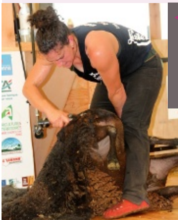
▲ LA TONTE NÉCESSITE À LA FOIS PRÉCISION ET AMPLITUDE. Les vêtements des tondeurs sont spécialement conçus pour leur faciliter la tâche tout en préservant leur santé.

Les vêtements conçus pour l'exercice de la tonte visent avant tout une grande liberté de mouvement et la résistance. Ainsi, les chaussures, des mocassins appelés Supamoc, ne comportent pas de coutures ni de talon. Le suint des brebis attaque les fils et les coutures lâchent alors rapidement. L'absence de talon se justifie par la position du tondeur qui est toujours courbé. Les talons accentueraient l'angle d'inclinaison du dos. Les mocassins existent en version hiver, en feutre ou pour l'été en cuir. Quelle que soit la matière, la chaussure doit être souple, afin que le tondeur sente la brebis à travers et puisse modifier la position de celle-ci par une simple pression des orteils. Les pantalons des tondeurs