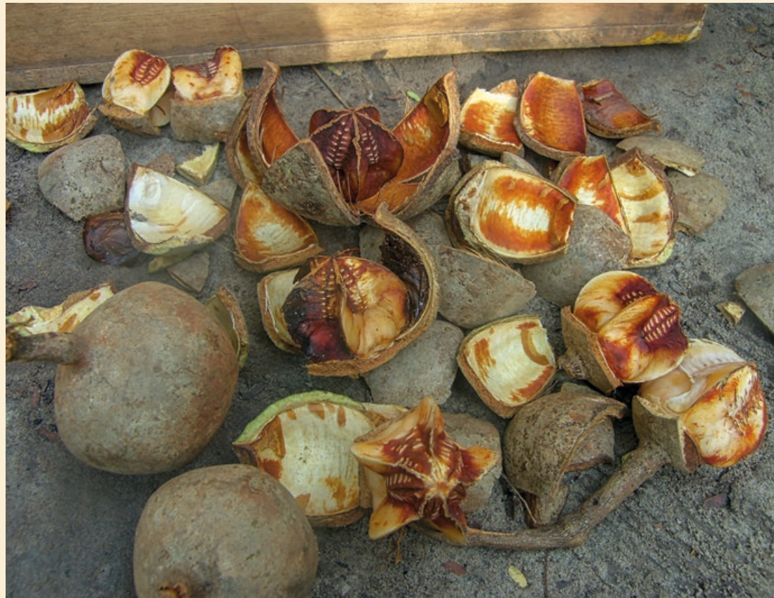
Photo 1. Fruits (capsules) de Khaya anthotheca , récoltés dans la région de la Sangha, République du Congo.

Doi : 10.19182/bft2019.339.a31714 – Droit d'auteur © 2018, Bois et Forêts des Tropiques – © Cirad – Date de soumission : 12 février 2018 ; date d'acceptation : 30 octobre 2018 ; date de publication : 30 janvier 2019.