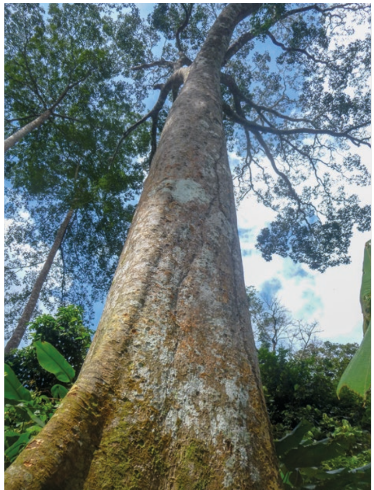
Photo 2. Pied de Khaya anthotheca dans la région de l'Est, Mindourou, Cameroun.

Cette double problématique, de difficulté de la délimitation des espèces et de confusion de ces espèces sous des appellations commerciales génériques, se retrouve parmi les « acajous d'Afrique » du genre Khaya , Meliaceae (APG III, 2009). Cette famille fournit certains des bois les plus prisés du continent, dont le bois d'acajou d'Afrique (De Wasseige et al. , 2012). Les espèces du genre Khaya sont exploitées industriellement pour leur bois depuis près de 200 ans (CTFT, 1959, 1988) et elles sont aussi largement employées dans la pharmacopée traditionnelle depuis des temps