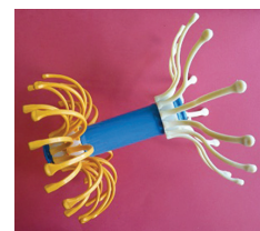
Figure 6. Anipill