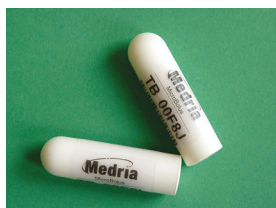
Figure 3. Velphone