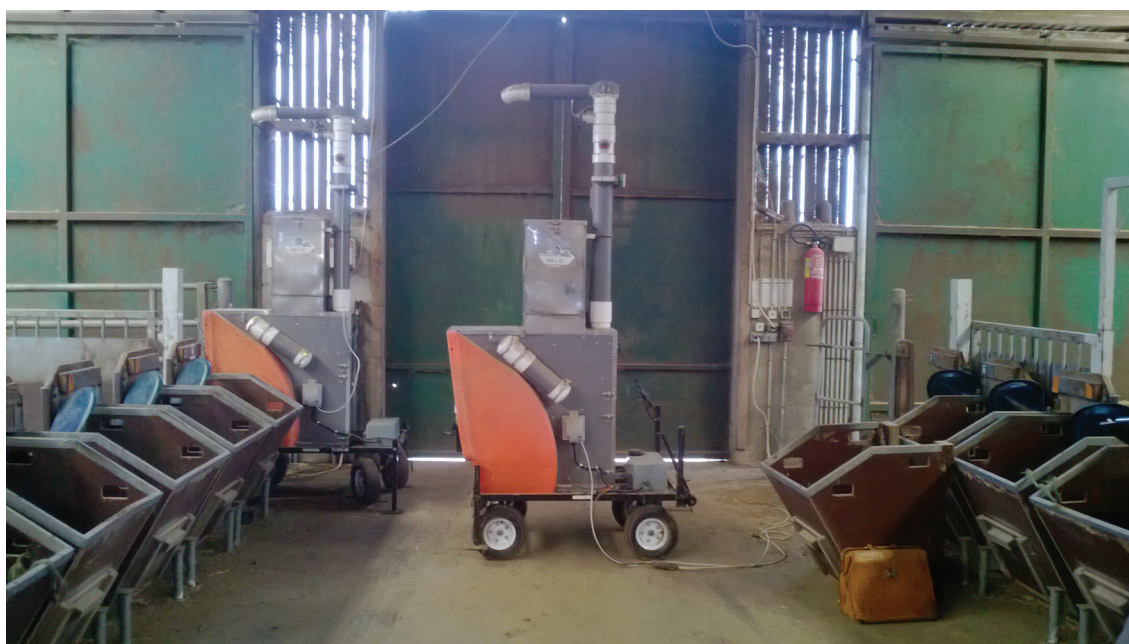
Figure 1. La mise en place en bâtiment.

Pour réussir à mesurer sur quatre campagnes, 300 génisses et leurs demi-frères, les systèmes Greenfeeds semblaient être les plus adaptés. Toutefois, une modification a été nécessaire au sein des bâtiments de la station de contrôle individuelle (SCI). Chaque appareil peut ainsi mesurer 12 animaux par case, soit 36 par cohorte. La priorité des mesures a été donnée aux femelles et seulement sur une moitié des cohortes de mâles. Et dans les GFs, ces génisses disposaient de 500 g par jour de concentré. Les mâles avaient une ration sèche, à base de concentré et de paille à volonté.