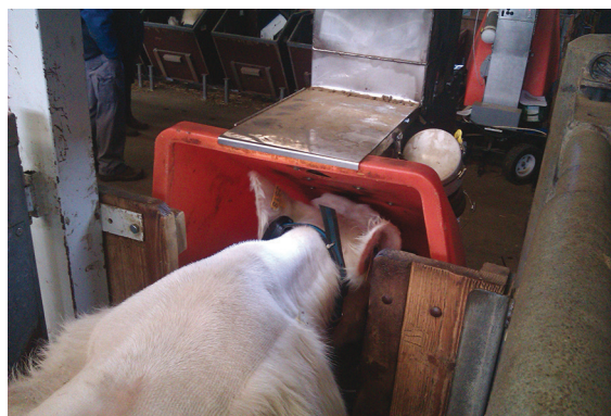
Figure 2. Un animal en pleine mesure.

Un système envoie un flux d'air homogène en continu qui démarre depuis l'auge en inox insérée dans la partie orange pour monter vers le haut de la colonne (Figure 1). Régulièrement, l'appareil relâche de fines quantités de propane pour tester le capteur et ainsi contrôler s'il y a dérive ou non. Avec une mesure journalière de la concentration