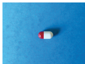
Figure 5. Termolplant