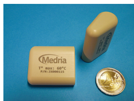
Figure 4. Thermo Bolus