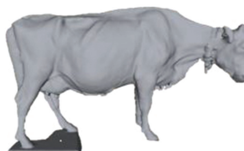
Figure 3. Photo du scanner en train d'acquérir la forme d'une vache (à gauche) et le résultat du scan complet (à droite) visualisé et traité avec le logiciel Meshlab ( http://www.meshlab.net/ ).