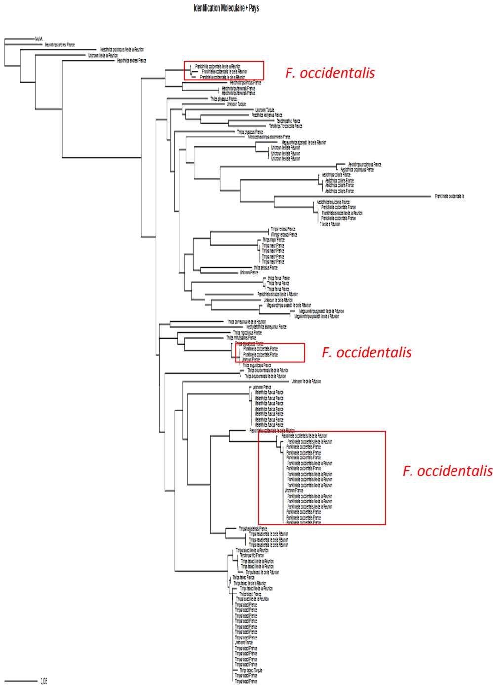
Figure 2 : Arbre phylogénétique obtenu pour le locus Cytochrome Oxydase I (COI) et qui illustre la diversité des thysanoptères collectés dans le cadre du projet. Cet arbre a été réalisé via la méthode de Neighbor Joining avec les paramètres des distances de Kimura 2 (500 répliques). Sont indiqués 3 clades distincts de Frankliniella occidentalis , indiquant une possible ambiguïté dans les identifications morphologiques.