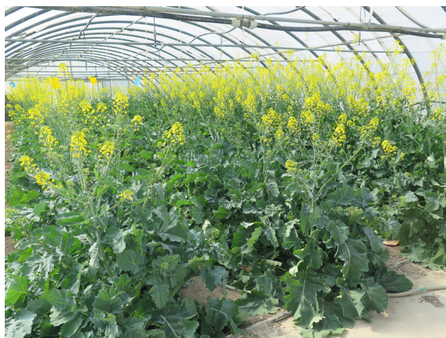
Fig. 1. Tunnel insectproof abritant les deux lignées de colza mâle stérile (les deux rangs de gauche) et F1 Exocet (les deux rangs de droite) en milieu de floraison.

D'après le ressenti des apiculteurs, les rendements en miels des colonies d'abeilles mellifères sont moindres lorsqu'elles sont apportées sur des cultures de production de semence hybride. Une première étude a en effet pour l'instant montré