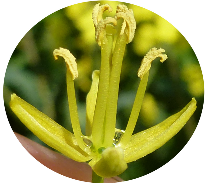
Fig. 5. Fleur mâle fertile de colza d'hiver dont on a retiré les pétales et sur laquelle on distingue les deux gouttes de nectar situées au niveau des nectaires latéraux, à la base du pistil et des étamines courtes.

Les récoltes de nectar des prélèvements initiaux ont été réalisées à l'aide de microcapillaires de 1 \mu\text{L} , puis de 0.5 \mu\text{L} pour retirer le nectar résiduel potentiel, cette étape ayant été réalisée avec précaution pour ne pas endommager les nectaires. Seul le nectar des deux nectaires latéraux était échantillonné dans chaque fleur (Fig. 5), ces nectaires produisant 95 % du nectar sécrété par la fleur (Davis et al. , 1986, 1998). Lorsque le nectar était visqueux, c'est-à-dire dans les situations de fortes concentrations et de faibles températures (Nicolson et Thornburg, 2007), situations qui intervenaient systématiquement au moins en fin d'après-midi après 16h00 GMT, les microcapillaires étaient laissés en contact avec les nectaires durant 3 à 5 minutes (Fig. 6). Enfin, pour la valeur de température associée à chaque mesure de taux de sécrétion brut de nectar, nous avons calculé la moyenne de l'ensemble des températures instantanées