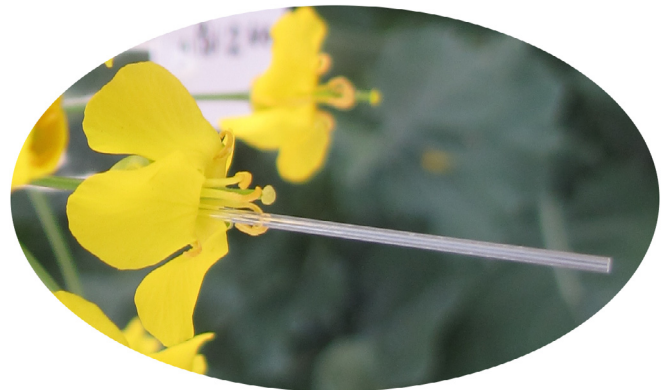
Fig. 6. Échantillonnage de nectar dans une fleur mâle fertile de colza à l'aide d'un microcapillaire.

enregistrées par le capteur durant la période comprise entre l'heure (à 5 minutes près) du prélèvement initial et l'heure de la mesure du taux de sécrétion brut.