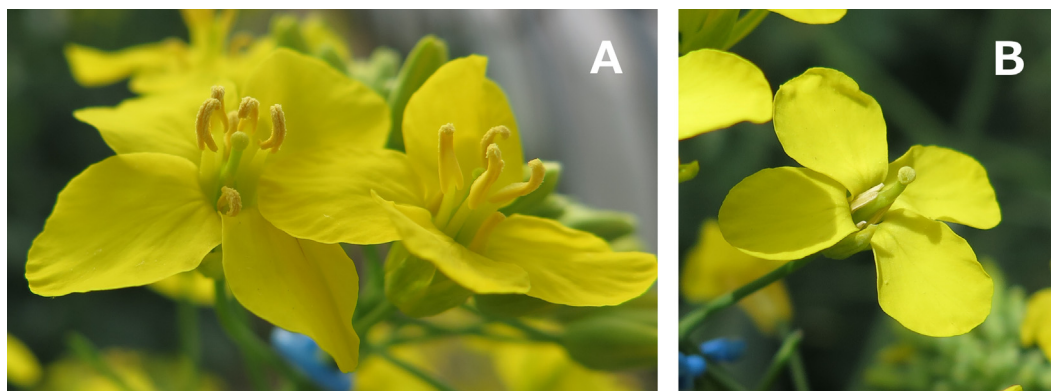
Fig. 2. (A) Fleurs mâle fertile F1 de colza d'hiver Exocet au 1 er jour d'anthèse (à droite) et 2 e jour d'anthèse (à gauche). (B) Fleur mâle stérile, lignée parentale d'«Exocet», au 1 er jour d'anthèse.

et de disposer ainsi d'une floraison plus étendue dans le temps pour nos mesures. Les plantes étaient arrosées quotidiennement par un système de goutte-à-goutte afin d'éviter qu'elles ne soient en déficit hydrique. La température instantanée était enregistrée toutes les 2 min 30 par un capteur HOBO ® Pro v2 (Onset ® Computer Corporation, USA).