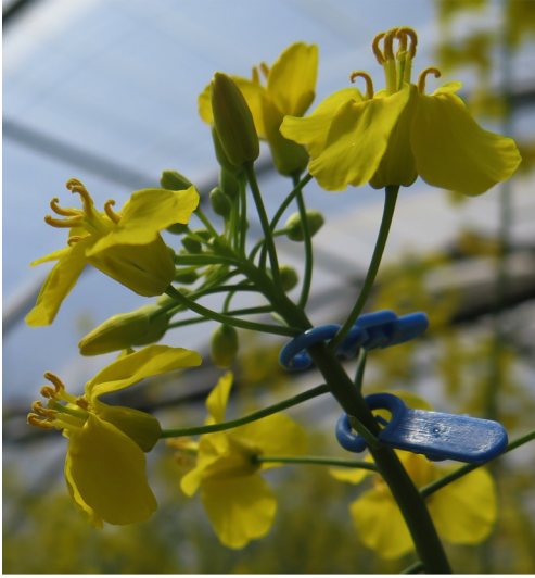
Fig. 4. Hampe florale de colza avec deux marqueurs de fleur délimitant une cohorte de deux fleurs mâle fertile de même âge.