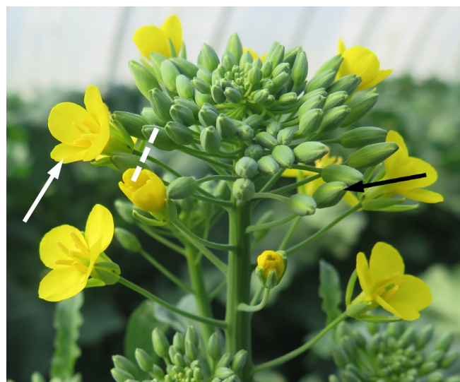
Fig. 3. Hampe florale mâle fertile de colza dont une fleur épanouie (flèche blanche à gauche) se situe au-dessus d'un bouton encore fermé (flèche noire à droite). La ligne blanche en pointillés symbolise la zone où les fleurs étaient sectionnées, en haut du pédoncule, pour disposer de fleurs du même âge dans les cohortes sélectionnées.

prélèvement initial au même moment, puis une mesure de sécrétion nectarifère au même moment. L'heure de prélèvement initial était alors notée sur une étiquette à fil attachée autour de la hampe.