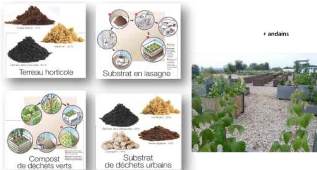
Figure 2 : Les substrats organiques testés (en bacs), lors du projet « Revitalisation Agri-urbaine ».

Ces techniques ont été développées sur la zone pédagogique du démonstrateur d'agriculture urbaine. 9 systèmes de cultures ont été comparés, initialement sur 4 cultures (fraises, framboises, salades, courgettes) puis sur 2, plus aisées à conduire dans les différents systèmes et à comparer (fraises, salades).