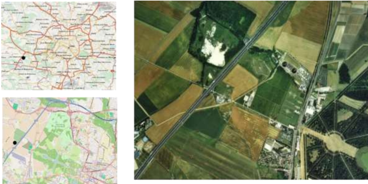
Figure 1 : Site du démonstrateur d'agriculture urbaine à Saint Cyr l'Ecole.

Le projet s'est appuyé sur le démonstrateur d'agriculture urbaine Les Fermes en Ville (Figure 1), développé à partir du printemps 2014 par l'association Le Vivant et la Ville sur un site dégradé et délaissé à Saint-Cyr l'Ecole (78).