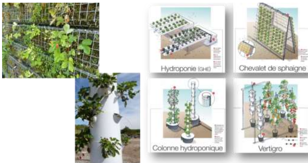
Figure 3 : Les systèmes hydroponiques testés (substrats inertes), lors du projet « Revitalisation Agri-urbaine ».

Les résultats obtenus ont permis d'identifier les forces et faiblesses de ces techniques pour différents objectifs. Si des techniques sur substrats organiques peuvent avoir une meilleure productivité au plant (ex : substrat organique de terreau amendé de biocharbon), des techniques hydroponiques peuvent avoir une densité de plants par m 2 au sol, et un confort de travail plus intéressants (ex : manutention nécessaire à l'interculture, temps de repiquage, station debout, etc.).