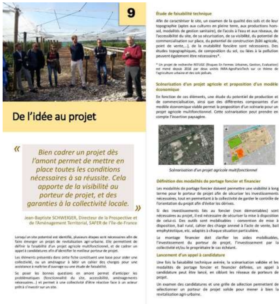
Figure 5 : Extrait du guide méthodologique « Revitalisation agri-urbaine ».

Une dynamique a également été engagée autour de la formation professionnelle , avec l'élaboration d'un référentiel pour une formation de niveau V (CAP) sur les aspects propres aux techniques de culture hors-sol et au contexte urbain, et un projet de Licence Professionnelle (niveau II). Une plateforme pédagogique autour des techniques hors-sol est en cours de mise en place dans l'un des centres de formation.