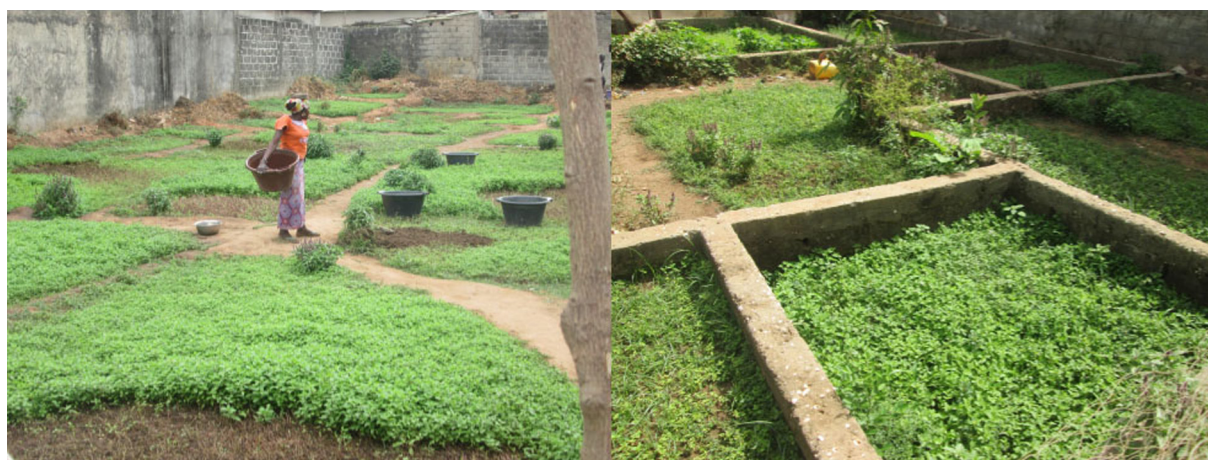
Fig. 3. Cultures de menthe dans les maisons et bâtiments en construction.