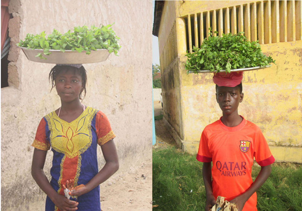
Fig. 5. Vendeurs ambulants de plantes aromatiques et médicinales dans le quartier de Néma 2. Fig. 5. Street traders of aromatic and medicinal plants in Néma 2 district.