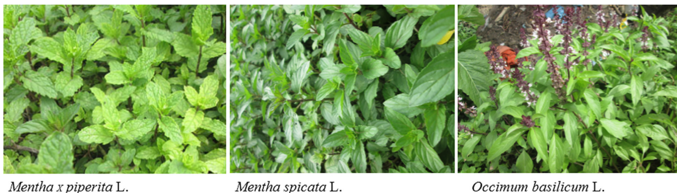
Fig. 2. Plantes aromatiques cultivées à Ziguinchor.