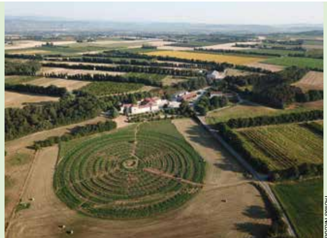
SCHÉMA DE LA PREMIÈRE ZONE DU PROJET Z, MÉLANGEANT DIFFÉRENTES PRODUCTIONS FRUITIÈRES

Le projet Z de l'Inra Gotheron teste un verger repensé pour rendre l'espace de production difficile à investir par les bioagresseurs : effets barrière-dilution, plantes pièges... Le verger de la première zone de 1,6 hectare est entouré de haies et de variétés pièges pour un effet barrière. Il alterne les espèces fruitières disposées en spirales imbriquées. L'objectif est de créer un espace de production de fruits sans pesticide et à très bas intrants.