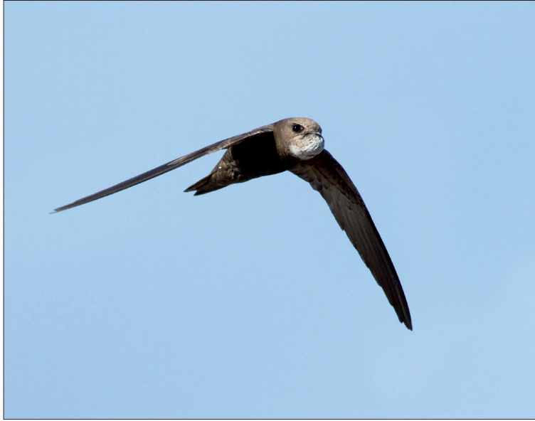
2. Martinet pâle Apus pallidus , Pyrénées-Orientales, août 2013. Noter le gonflement de la gorge, pleine d'insectes destinés aux jeunes. Pallid Swift .