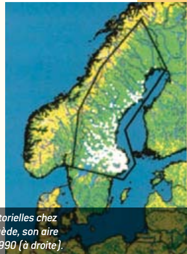
La tique Ixodes ricinus (à gauche), principale espèce vectrice de maladies vectorielles chez l'homme en Europe, devrait continuer à s'étendre au cours du XXI e siècle. En Suède, son aire de répartition (points blancs) a doublé entre les années 1980 (au centre) et 1990 (à droite).