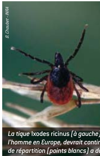
B. Chaudet - INRA

L'évolution génétique naturelle des micro-organismes y occupe la cinquième place. À titre d'exemple, rappelons que la mutation du virus du Chikungunya, qui s'est produite en septembre 2005 à La Réunion, a déclenché une épidémie de grande envergure qui a frappé plus de 300 000 habitants des îles de l'océan Indien. Les changements démographiques, sociétaux et comportementaux (les pratiques à risque, notamment) figurent à la deuxième place.