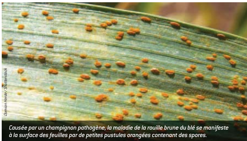
Causée par un champignon pathogène, la maladie de la rouille brune du blé se manifeste à la surface des feuilles par de petites pustules orangées contenant des spores.

Examinons à présent le cas des maladies à transmission vectorielle, telles que le paludisme, la dengue ou la fièvre jaune. Ces systèmes infectieux plus complexes se propagent d'un individu hôte à un autre par l'intermédiaire de vecteurs, de petits arthropodes qui se nourrissent de sang : moustiques, moucheron, poux, punaises, tiques, etc. Chez l'homme, les maladies vectorielles sont responsables de près d'un quart des épidémies émergentes recensées dans le monde. Puisque les vecteurs ne régulent pas