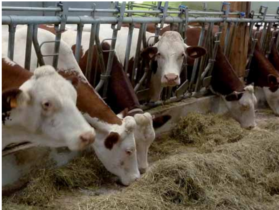
La suppression des quotas laitiers à l'hectare devrait favoriser la progression des grands élevages en bâtiments

La baisse du nombre d'exploitations laitières devrait se poursuivre dans les années à venir sous l'influence de trois facteurs principaux : l'augmentation de la productivité du travail est facilitée par l'arrivée des nouvelles technologies de traite (robotisation) ; la spécialisation de certaines exploitations autour de l'activité laitière pourrait se renforcer, quitte à externaliser certaines tâches telles que celles liées au travail du sol ; certaines exploitations individuelles fusionnent pour donner lieu à des structures multi-associés de plus grande taille (20 % des vaches laitières en France sont concentrées dans des étables de plus de 100 vaches). Le rythme de la restructuration à venir n'est cependant pas écrit à l'avance. Il dépendra aussi des nouvelles formes de relations contractuelles entre les producteurs et les industriels (modalités de transfert des contrats entre agriculteurs), de l'évolution du prix de l'énergie, des modalités d'attribution des aides directes de la PAC et des futurs rapports de prix entre productions agricoles. Avec la suppression des quotas, il demeure fort probable que la production laitière se concentrera davantage dans les zones et les exploitations les plus compétitives. Les politiques environnementales auront, sur ce point, une influence majeure car elles jouent parfois le rôle de contrepoids face aux phé-