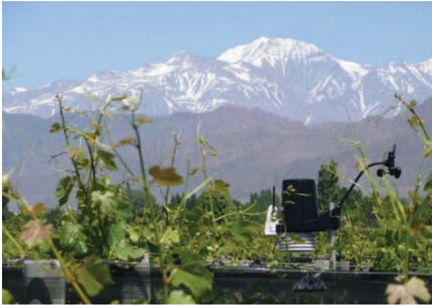
Station météo miniaturée dans le vignoble argentin. Monter en altitude ou changer de latitude peut être un moyen de s'adapter au changement climatique.