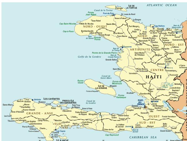
Figure 1. Carte des zones d'enquêtes