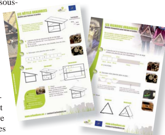
Différents modèles de nichoirs faciles à réaliser sont disponibles sur le site.

tion des professionnels et un guide des bonnes pratiques à destination des collectivités et des habitants 2 .