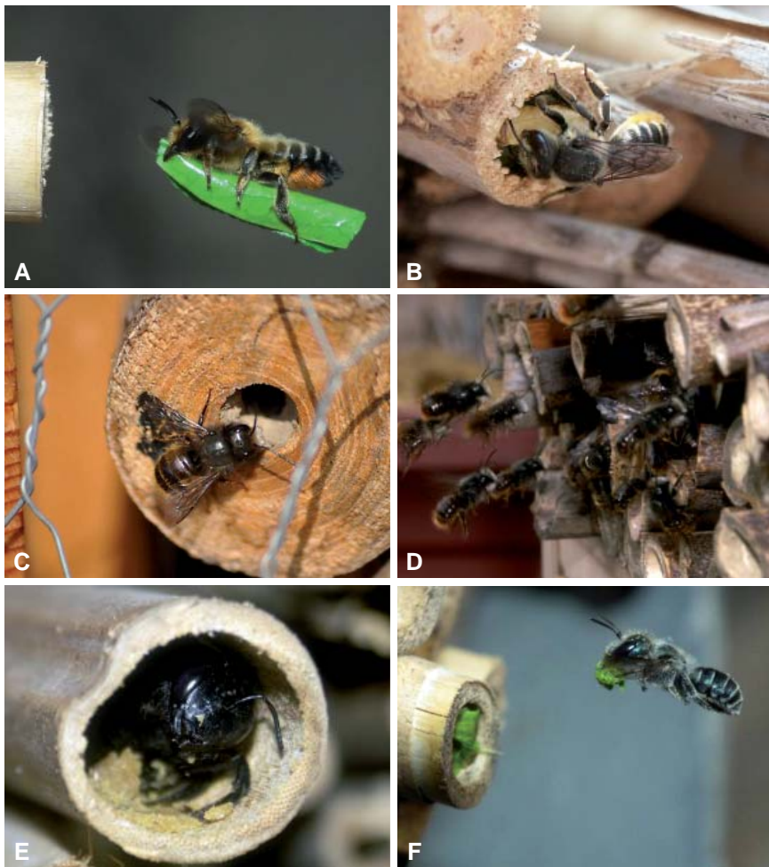
A- Après avoir découpé un morceau de feuille, cette femelle de mégachile ( Megachile sp.) le transporte jusqu'à son nid. Les morceaux sont ensuite enroulés comme des petits cigares qui formeront les loges larvaires - Cliché Jérôme Gauthier. B- Mégachile introduisant un morceau de feuille dans une tige - Cliché Hugues Mouret. C- Une Osmie cornue ( Osmia cornuta ) bouche l'ouverture de son nid - Cliché Eric Boglaenko. D- Mâles d'Osmie cornue volant devant le nichoir dans l'attente de la sortie des femelles - Cliché Hugues Mouret. E- Femelle de Xylocope ( Xylocopa sp.) dans une tige de bambou - Cliché Hugues Mouret. F- Femelle d'Osmie bleue ( Osmia caerulea ) rapportant des morceaux de feuilles déchiquetés qui seront broyés pour former un ciment végétal et obstruer l'entrée du nid - Photo Jérôme Gauthier.

choix d'une flore indigène adaptée aux besoins des espèces d'abeilles locales, la réduction de l'artificialisation des milieux en limitant autant que possible les surfaces imperméables et en maintenant des espaces de terre à nue, et le renforcement des continuités écologiques entre les différents milieux. Pour encourager la mise en œuvre de ces pratiques, plusieurs sessions de formation ont été organisées auprès des agents des espaces verts, des agriculteurs et des élèves de formations professionnelles et de lycées agricoles ou horticoles. Parallèlement, les élus dont les communes sont impliquées dans le programme ont été sensibilisés aux enjeux liés à la préservation des abeilles sauvages, lors des