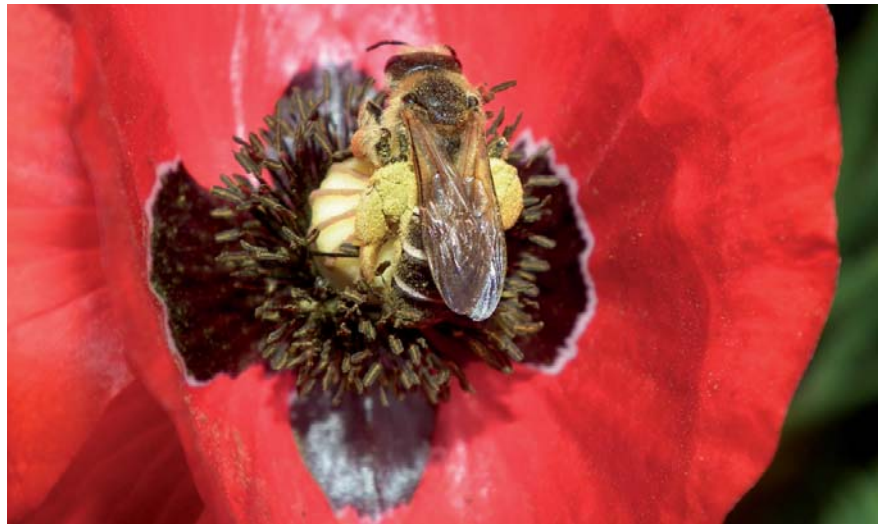
Un halicte sur une fleur de coquelicot - Cliché Jérôme Gauthier