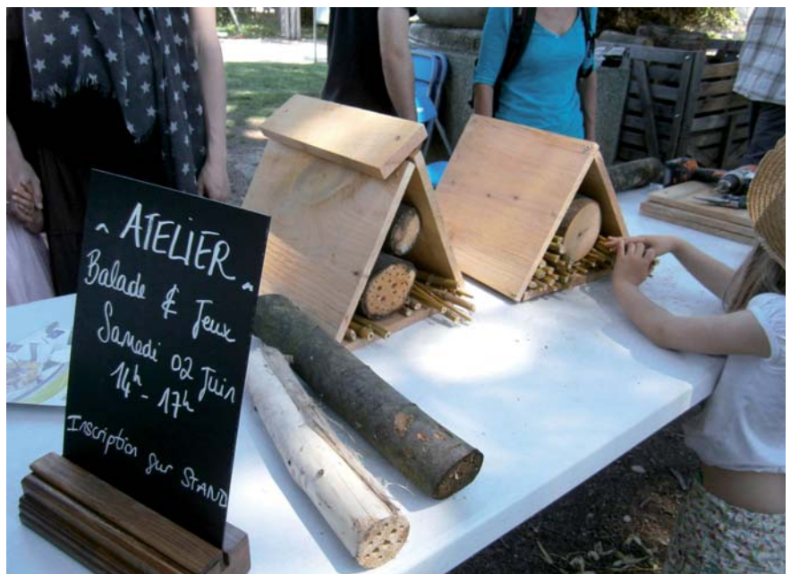
Atelier de construction de nichoirs et invitation à une balade à la découverte des abeilles sauvages

tion des professionnels et un guide des bonnes pratiques à destination des collectivités et des habitants 2 .