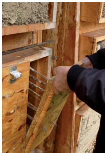
En haut, les tiges de bambou attirent de nombreuses osmies. Ci-dessus, Une bûche dont les trous sont operculés - À droite un casier pédagogique permettant d'observer le développement des abeilles

dénombrer près de 1 000 espèces en France dont l'Abeille domestique, 2 000 espèces en Europe et près de 20 000 sont connues dans le monde. Indispensables butineuses, leur richesse spécifique est la clé d'une pollinisation efficace. Or, leur déclin aura des conséquences importantes sur la biosphère et la vie des hommes, un tiers de notre alimentation et les trois quarts des espèces cultivées étant dépendantes de la pollinisation par les insectes. Le choix des villes pour le programme n'est pas anodin. Les milieux urbains et péri-urbains présentent de nombreux atouts pour les abeilles : on y trouve moins de pesticides que dans les zones d'agriculture intensive conventionnelle, la température qui y est légèrement plus élevée bénéficie aux abeilles pour la plupart thermophiles, les parcs urbains offrent une floraison abon-