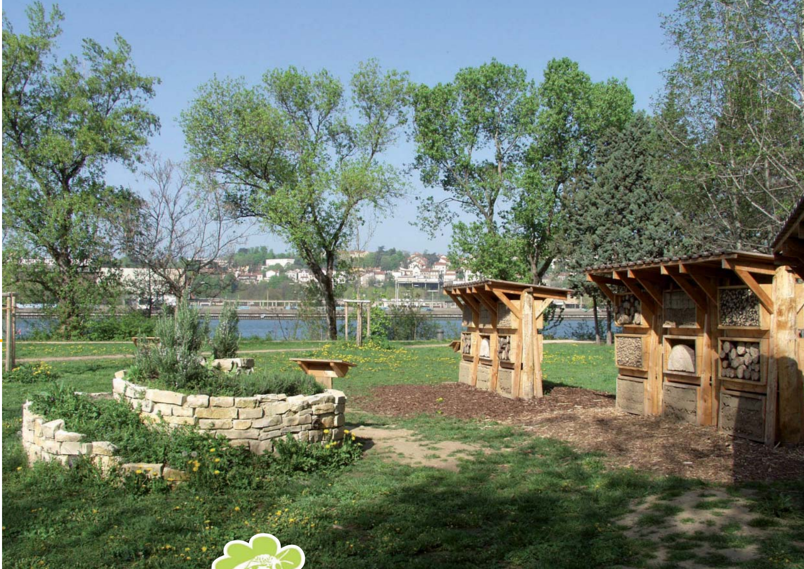
Site aménagé dans le Parc de Gerland (Lyon)