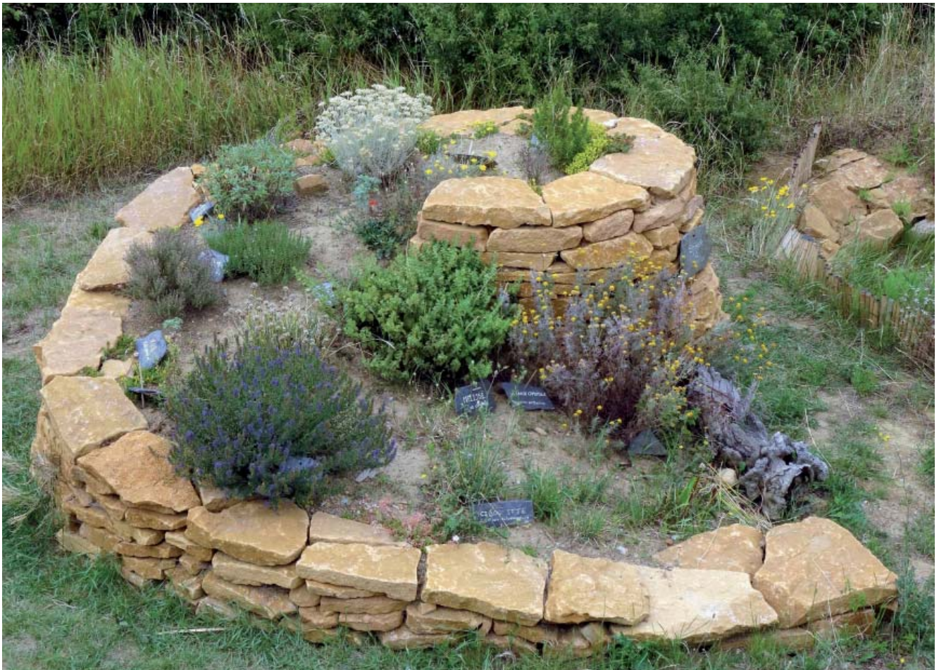
Spirale à insectes et aromatiques - Cliché Hugues Mouret

font apparaître la nécessité d'une coordination et d'une gestion collective des enjeux liés à la biodiversité en ville qui tiennent compte des possibles divergences de perceptions et d'intérêts. Par exemple, pour les aménagements testés dans le cadre d'un protocole scientifique, il faudra concilier le besoin d'une implantation favorable (pour les chercheurs) avec leur impact visuel, tout en informant les administrés sur la démarche (élus et services techniques). Après une année ou deux, les premiers effets des changements de pratiques et des efforts fournis sur le nombre et la diversité des abeilles sauvages présentes sur un site peuvent être mis en avant par les communes. On constate également que, dans chaque commune, les services des espaces verts et les jardiniers sont les véritables porteurs techniques des aménagements et des transformations attendues. Ils installent les structures, et une fois celles-ci en place, les entretiennent. Ils sont