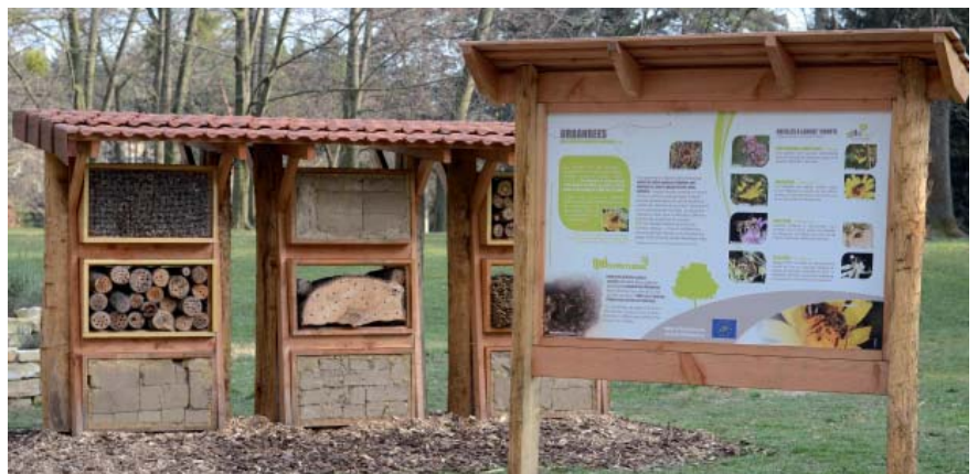
Sur certains sites (ici le parc de la Tête d'or en automne), des panneaux informent sur les occupants des hôtels

■ L'HÔTEL COMME OBJET SCIENTIFIQUE Le programme Urbanbees a ceci d'innovant qu'il teste de nouvelles approches de conservation. Entre 2010 et 2012, seize sites urbains et péri-urbains ont été aménagés dans le Grand Lyon et sa périphérie. Trois types d'aménagement favorisent la nidification des abeilles sauvages : des hôtels, des spirales à insectes et des carrés de sol. Pensés par un designer, les hôtels sont de grandes structures en bois remplies de bûches percées, de tiges creuses ou à moelle tendre, ou de terre. Pour répondre aux exigences écologiques de certaines espèces d'abeilles, différentes essences végétales y ont été testées (les bûches les plus appropriées semblent être : le sureau, le peuplier, le sophora et le platane, et pour les tiges : la canne de Provence, le bambou, l'ailante et le buddleia). La seconde structure, la spirale à insectes, est inspirée d'un modèle développé par des jardiniers anglais. Composé d'un muret de pierres monté en spirale et comblé d'une terre légère, sa disposition permet d'accumuler la chaleur et d'y cultiver des plantes aromatiques. Les fleurs et les interstices entre les pierres offrent gîte et nourriture à une multitude de petits animaux en un minimum d'espace. Mais les aménagements les plus novateurs sont enterrés. 70 % des abeilles sauvages nidifiant dans le sol, des espaces de terre nue délimités par