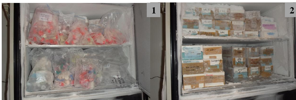
Photo 3. Situation à l'intérieur du congélateur avant (1) et après (2) la mise en place de la procédure.

La traçabilité des échantillons a été facilitée par l'étiquetage des boîtes carton par chaque équipe. De plus, l'optimisation des consommables a permis d'abaisser les coûts des consommables utilisés pour une campagne de récolte donnée de 30%. Enfin, nous avons également constaté un gain de temps conséquent lors des différentes étapes. En effet, le protocole d'échantillonnage est finalisé dès la récolte des fruits et seules les quantités nécessaires sont conditionnées en sachet. Au moment des analyses, un seul des 2 lots est manipulé, et à l'étape du broyage, la totalité du matériel est systématiquement broyée.