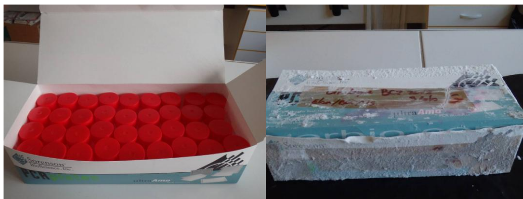
Photo 2. Suggestion de rangement des pots dans des boîtes de plaques PCR récupérées (ouverte et fermée).