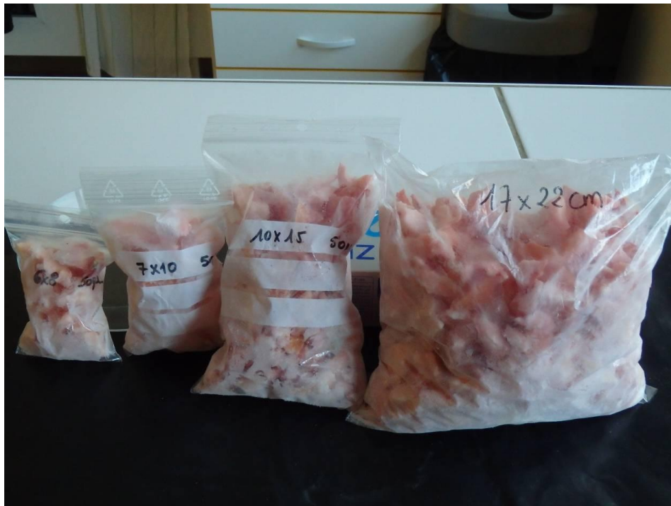
Photo 1. Les différents types de consommables et leurs contenus.

contenir la poudre de fruit après broyage des morceaux. En effet, la matière de ces pots permet une très bonne résistance thermique et chimique.