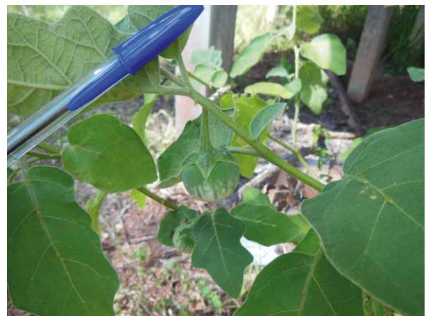
PHOTO 3: COULEUR VERTE RÉTICULÉE D'UN FRUIT D'AUBERGINE SPONTANÉE, EN THAÏLANDE

Thaïlande, dont les fruits ronds ou légèrement allongés, présentent une réticulation mêlant plusieurs tonalités de vert (photo 3) et ne pèsent que quelques grammes ou dizaines de grammes. Leurs tiges, feuilles et calices sont pourvus d'une densité d'épines très variable. Le statut de ces plantes est difficile à définir pour plusieurs raisons. D'une part leur diversité morphologique laisse deviner l'existence de pollinisations croisées avec les variétés cultivées, ce qui est confirmé par les analyses biochimiques. D'autre part, les types spontanés un peu éloignés des villages ne sont pas vraiment sauvages car les hommes sont toujours passés un jour ou l'autre là où on les trouve. Enfin, il existe des variétés modernes dans ces typologies « primitives », parfois même des hybrides F1 (il faut donc manier avec précaution le concept de « primitif »). En Thaïlande, les formes spontanées ont un statut particulièrement complexe car elles poussent un peu n'importe où dans les villages ou à proximité et les habitants en détruisent certaines tout en prenant soin des autres. Ils appellent « sauvages » les plantes dont les fruits ne croquent pas sous la dent et sont