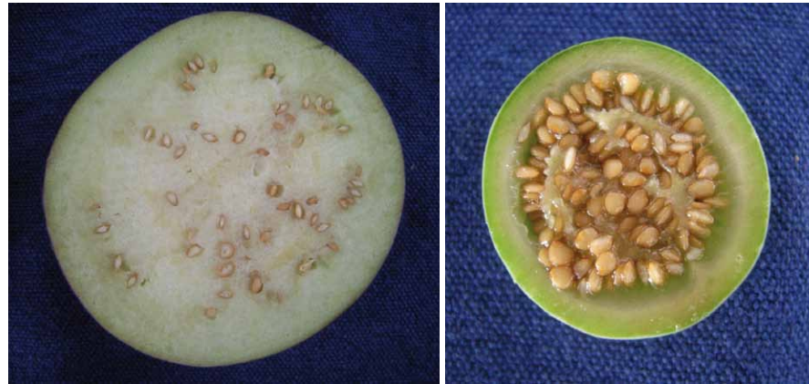
PHOTO 6: LE FRUIT D'UN CULTIVAR D'AUBERGINE (À GAUCHE) PRÉSENTE UNE PLUS GRANDE PROPORTION DE CHAIR QUE LE FRUIT D'UNE AUBERGINE SAUVAGE (À DROITE). LE FRUIT SAUVAGE CONTIENT SURTOUT DES GRAINES. LES DIAMÈTRES DES DEUX FRUITS NE SONT PAS PROPORTIONNELS SUR CES PHOTOS, LE DIAMÈTRE DU FRUIT SAUVAGE ÉTANT TRÈS INFÉRIEUR AU DIAMÈTRE DU CULTIVAR.

amers. Comme on trouve en proportion équivalente celles à fruits croquants et moins amers, on peut penser que les goûts pour ces deux types coexistent depuis longtemps.