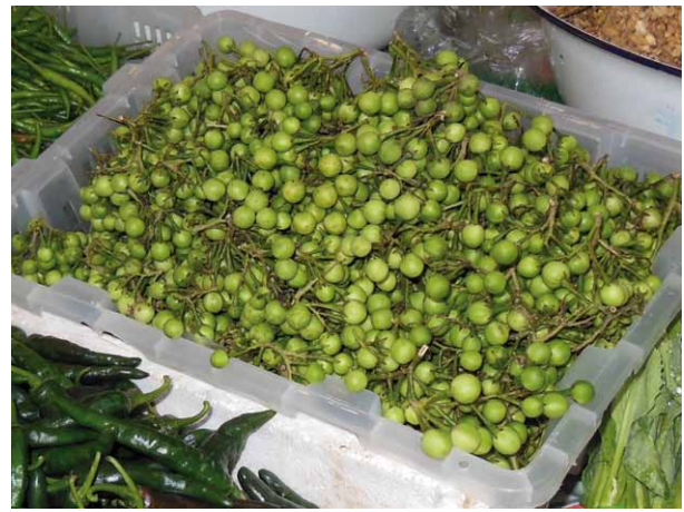
PHOTO 2: FRUITS DE SOLANUM TORVUM SUR UN MARCHÉ EN THAÏLANDE (DIAMÈTRE ~ 1 CM)

On trouve encore aujourd'hui des formes spontanées d'aubergine, principalement à proximité ou dans les villages en Asie du sud-est, notamment en Inde, Birmanie et