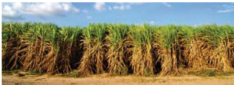
La canne à sucre peut être utilisée pour produire des biocarburants.