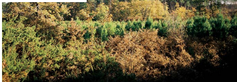
Peuplement diversifié

Le paysage du massif landais est souvent perçu sous l'angle de son homogénéité [voir encadré] : dominance des peuplements forestiers de pin maritime. Or, entre les pins, une approche fine permet de constater que les boisements feuillus tiennent une certaine place dans le paysage forestier. Il peut s'agir de formations linéaires plus ou moins larges : galeries forestières le long des rivières et cours d'eau mêlant aulnaies, chênaies à chêne pédonculé ou chêne tauzin en fonction du rabattement de la nappe induite par l'encaissement de la vallée, lisières de chênes ou de bouleau bordant les pinèdes en limite de propriété ( barradeaux, dougues ), le long des routes, des crastes ou des fossés. On recense aussi des taches de feuillus formants des bosquets plus ou moins denses et étendus. Ils peuvent avoir des origines anciennes (airiaux, parcs à moutons, garennes, etc.). Une analyse spatiale en cours à l'échelle du département des Landes révèle que l'ensemble de ces boisements feuillus forme un réseau