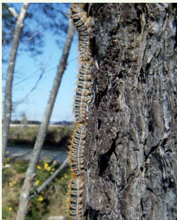
Chenilles processionnaires

jeunes et ceux dont la survie est menacée) ou de limiter les risques d'urtications dont les conséquences sanitaires peuvent être graves pour l'homme et certains animaux. Elle consiste, le plus souvent, à réaliser un traitement par voie terrestre ou aérienne 2 sur les premiers stades larvaires à l'aide d'un insecticide homologué, notamment par lutte biologique à base de Bacillus thuringiensis .