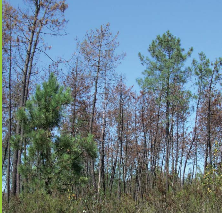
Dégâts de scolytes

La tempête Klaus a provoqué d'importantes perturbations de l'écosystème forestier. Ceci a conduit à des problèmes sanitaires multiples, certes attendus, mais dont l'ampleur est inégale. L'introduction de plus de diversité, notamment par les feuillus, apparaît comme étant une voie possible d'un meilleur état sanitaire.