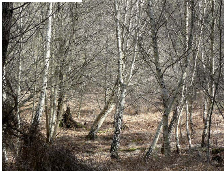
Bouleaux en îlot (CRPF Aquitaine)

A l'échelle du massif, l'objectif à privilégier est le maintien ou le renforcement des boisements de feuillus pour la constitution de réserves de faune auxiliaire. Des études menées sur le massif aquitain ont en effet montré que les bois de feuillus sont particulièrement riches en espèces d'oiseaux, d'insectes et d'araignées capables de réguler les populations d'insectes herbivores grâce à leur activité prédatrice. Par exemple, les bosquets feuillus sont des milieux refuges pour les oiseaux insectivores, consommateurs de chenilles processionnaires (huppe fasciée, mésange charbonnière). Ils accueillent aussi des prédateurs d'insectes ravageurs (parasites de la pyrale du tronc).