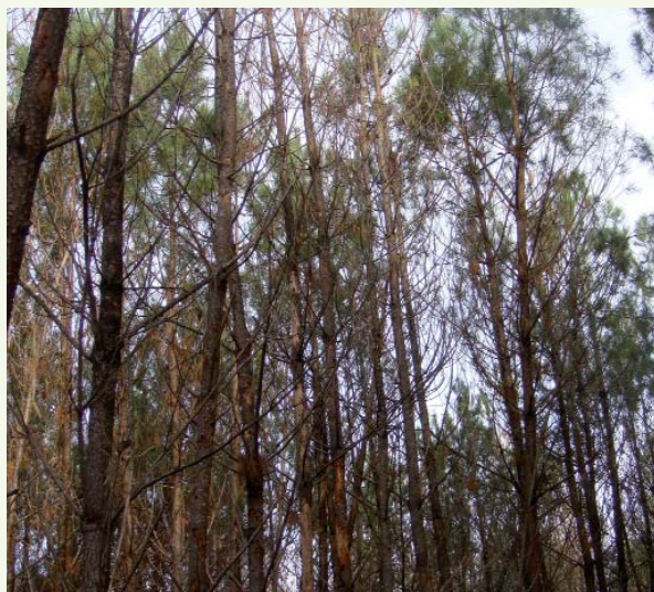
Peuplement sinistré avec dégâts de scolytes

Après 2009, il s'attendait à ce que les scolytes attaquent les chablis. En conséquence, il a fait exploiter ses gros bois le plus rapidement possible mais, faute d'acheteur, il s'est retrouvé devant l'impossibilité absolue d'exploiter les bois moyens. « Ces bois sont restés sur place jusqu'à l'hiver 2010. Cette année-là a vu une attaque de très grande ampleur. Il y avait de la matière par terre puis les insectes se sont attaqués aux arbres sains ». Sur ses propriétés de Luglon et Vert, tous les peuplements d'âge moyen, abîmés à plus de 70 % par la tempête et non exploités, ont été « scolytés ». « Un peuplement plus jeune, entouré de chablis exploités dès l'été 2009 a été épargné. Il semble que les vents dominants ont influencé la progression des insectes. Mais il est sûr que l'on a aussi transporté des scolytes avec le bois et que l'on a contribué à infester des peuplements qui s'en seraient sortis autrement ». M. Boyau a aussi fait l'expérience de pins de 40 ans épargnés par la tempête et attaqués par l'ips 5 en 2010. A l'automne, il a fait exploiter les tâches attaquées en maintenant le peuplement restant qui lui semblait viable. Cette décision a permis de limiter les pertes sur la valeur des bois. Il y avait un risque car sa parcelle est entourée de peuplements touchés non encore exploités, mais en 2011 les attaques n'ont pas progressé.