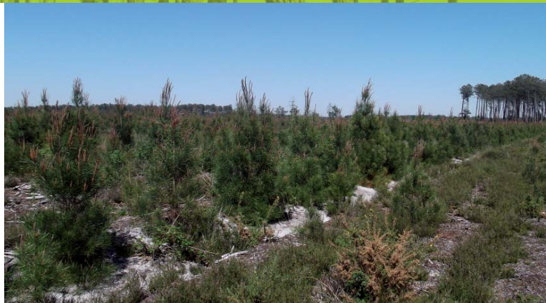
Jeune plantation de pin maritime

Dans « le triangle de la pathologie » arbres-environnement-parasites, le forestier ne peut agir préventivement qu'en pratiquant une sylviculture innovante adaptée au changement global. Cela se traduit par une conduite dynamique des peuplements afin de réduire notamment la compétition et les risques liés à la sécheresse. Par une diversification des peuplements, et