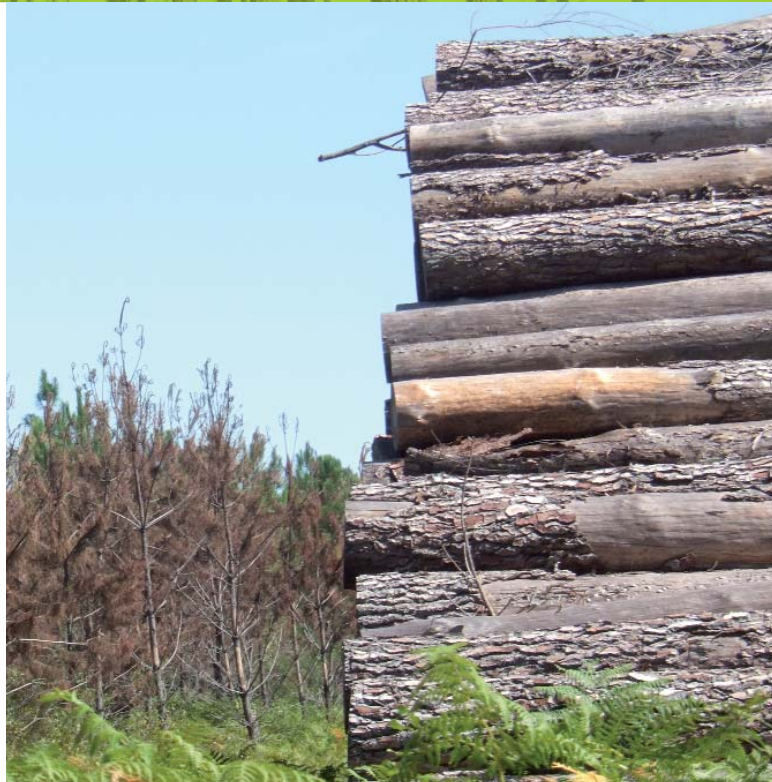
Pile de bois en bordure de parcelle et dégâts de scolytes

Après le répit hivernal, le traitement 2011 a été avancé au 15 mars par mesure de précaution. Il a été décidé qu'il serait systématique, ce qui a conduit à traiter près de 2 millions de stères bord de route (jusqu'en octobre 2011).