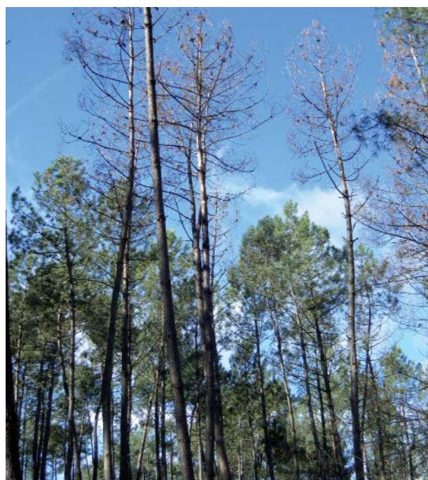
Dégâts de scolytes

A moyen terme, la prévention des attaques de scolytes dans les plantations de pin maritime passe par un renforcement de la vigueur individuelle des arbres. De nombreux travaux de recherche, menés notamment en Amérique du Nord, montrent clairement qu'un régime d'éclaircies régulières visant à renforcer la croissance radiale permet de maintenir un niveau élevé de résistance aux attaques de scolytes, via la production de résine toxique.