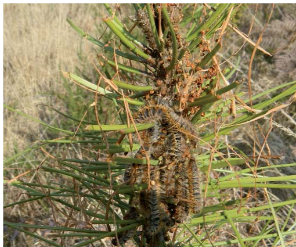
Dégâts de chenilles processionnaires

A court terme, après qu'une tempête ou un autre accident climatique (sécheresse, gel) ont brusquement augmenté le volume de bois favorable au développement des populations de scolytes, il convient de tout mettre en œuvre pour réduire au plus vite, dans l'idéal en quelques mois, ce substrat de reproduction. L'analyse des pullulations de scolytes typographes en Europe du Nord et sténographes en Aquitaine montre une corrélation très nette entre volume de chablis et pourcentage d'arbres scolytés, à l'échelle de la petite région forestière. Les mêmes études confirment l'efficacité de la récolte de chablis et bois récemment scolytés pour limiter les nouvelles attaques, avec un meilleur rendement dans les zones les plus touchées. Ces résultats suggèrent de concentrer les premières interventions de nettoyage dans les parties les plus impactées des massifs forestiers.