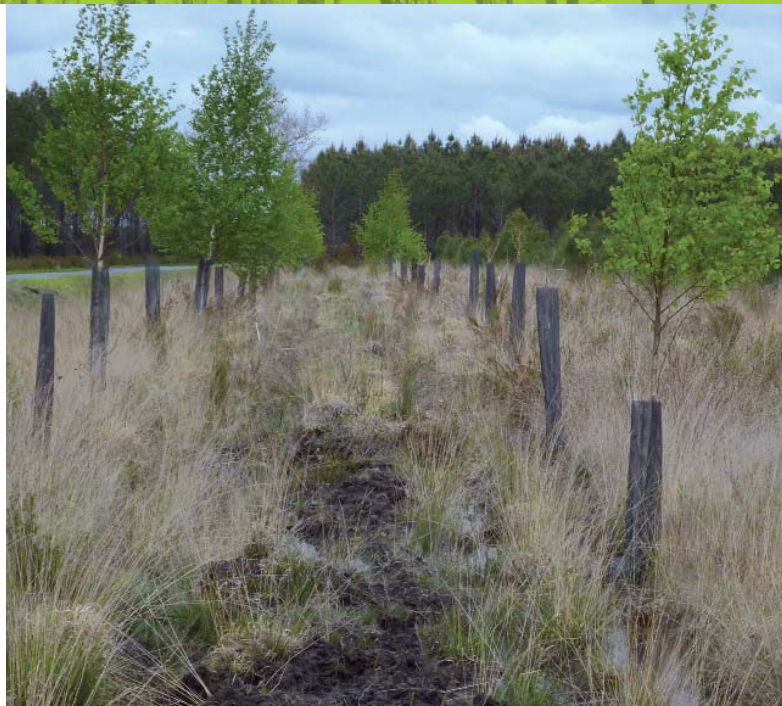
Création d'une lisière feuillue

La création de formations feuillues se fait par plantation en plein ou en enrichissement. Cependant ces coûteuses installations dans les milieux difficiles de la lande présentent des risques élevés de mauvaise reprise et donc souvent de mortalité. La plantation doit être accompagnée par un travail du sol et dans la plupart des cas par l'ajout d'une protection individuelle contre les cervidés. Les essences locales doivent être privilégiées, notamment dans la perspective de la protection sanitaire