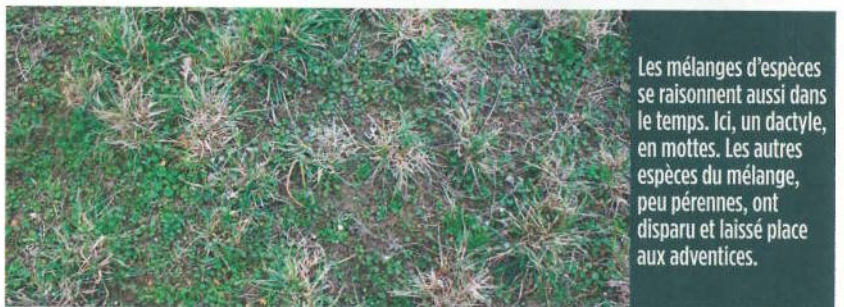
Les mélanges d'espèces se raisonnent aussi dans le temps. Ici, un dactyle, en mottes. Les autres espèces du mélange, peu pérennes, ont disparu et laissé place aux adventices.