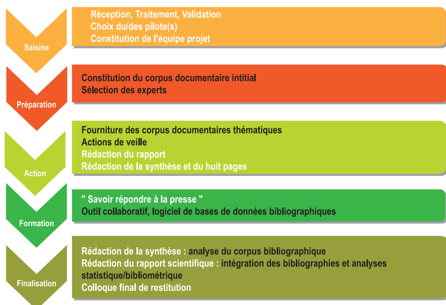
Figure 1. Principales étapes d'une expertise scientifique collective. La contribution des documentalistes est en noir.

La Figure 1 présente les différentes étapes d'une expertise scientifique collective.