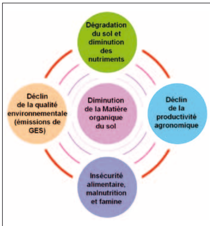
Figure 3 : The vicious cycle of loss of soil organic matter and its associated soil functions. According to Lal (2004). http://maps.grida.no/go/graphic/the-vicious-cycle-of-depletion .

(agricoles comme autres usages) sur le stockage de C et sur les quantités, qualités, localisation et dynamique des MOS.