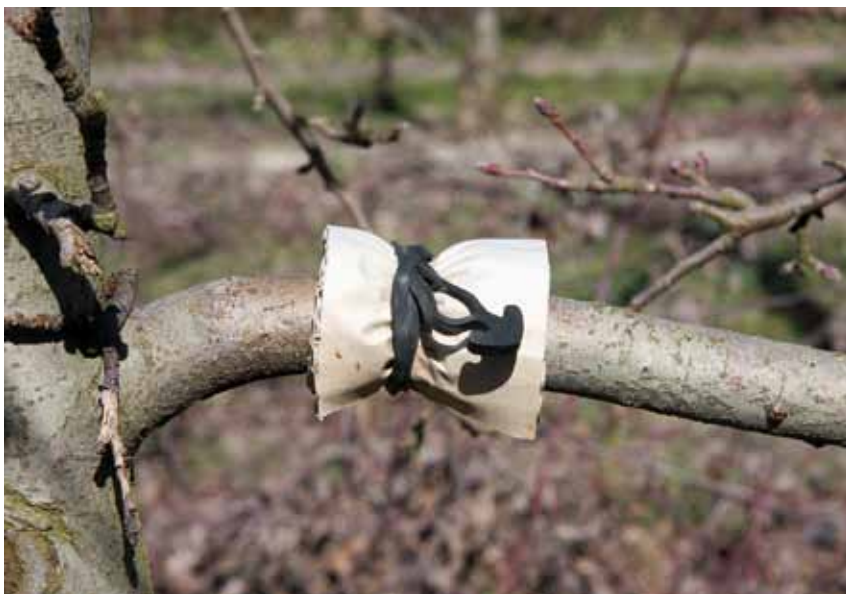
> BANDE PIÈGE CARTONNÉE POUR L'ÉCHANTILLONNAGE DES ARAIGNÉES

sont les seuls auxiliaires actifs en sortie d'hiver. Les seuils de températures de développement des pucerons D. plan-taginea et A. pomi sont respectivement de 4,5 et 5,9 °C alors que celui des araignées Philodromus spp est de 1,2 °C. Ces araignées sont donc actives au moment