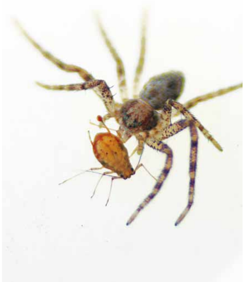
> PHLODROMUS SP CONSOMMANT UN PUCERON LORS D'UN TEST ALIMENTAIRE DE MISE AU POINT DE LA MÉTHODE D'ANALYSE MOLÉCULAIRE

L'étude de la prédation des ravageurs du pommier par des auxiliaires vertébrés et invertébrés et de leur potentiel de régulation s'est inscrite dans un projet de thèse de trois ans conduit par le Ctifl, en collaboration avec l'INRA d'Avignon et l'université de Cardiff (Boreau, 2012).