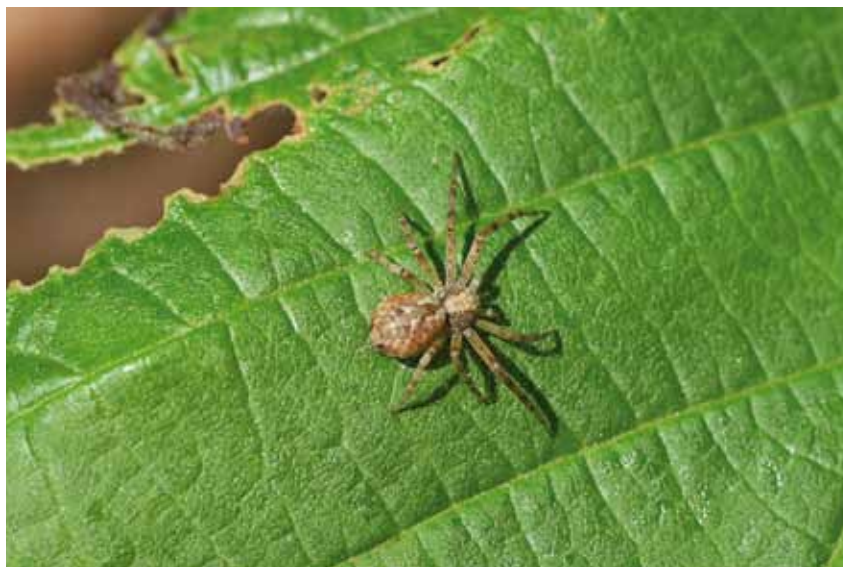
> PHLODROMUS SP EST FRÉQUENTE DANS LES VERGERS DE POMMIERS ÉTUDIÉS

Parmi les différentes espèces de pucerons retrouvées sur pommier ( Eriosoma lanigerum , Rhopalosiphum insertum , Aphis gossypii et Aphis pomi ) le puceron cendré, Dysaphis plantaginea , est le plus dommageable. Son cycle complet se réalise sur deux hôtes. De l'œuf pondu en hiver sur l'hôte primaire (pommier) émerge au printemps une fondatrice qui va engendrer par parthénogénèse plusieurs générations d'individus aptères. En fin de printemps, apparaissent des individus ailés qui vont assurer la migration vers le plantain Plantago spp. , l'hôte secondaire. Les colonies de pucerons aptères se multiplient rapidement sur cette plante jusqu'à ce que des indi-