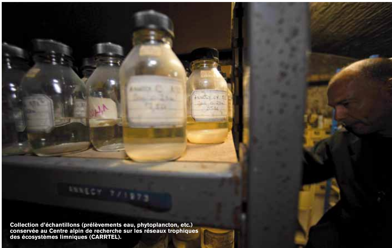
Collection d'échantillons (prélèvements eau, phytoplancton, etc.) conservée au Centre alpin de recherche sur les réseaux trophiques des écosystèmes limniques (CARTEL).

Lyon, s'est intéressée récemment au devenir des polychlorobiphényles (PCB) dans les lacs. Malgré leur interdiction en 1987, les PCB, dérivés chlorés écotoxiques, cancérigènes et persistants, sont encore susceptibles d'être présents dans la chaîne trophique. Largement utilisés entre les années trente et les années quatre-vingt dans de nombreux produits comme les isolants, liquides de refroidissement, plastiques, adhésifs et peintures, ils ont contaminé de nombreux cours d'eau. Peu biodégradables, ils se